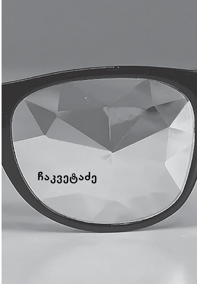
ნამს მოსწყინდება ბალახზე წოლა და ჩემს თვალზე ნამოსკუპდება.

ცას მივეახლე ამეთვისტოსფერს, დადლილი სული ისევ ელის მზეს და უბრუნდება შიშველ სტრიქონებს ომგადახდილი, როგორც ულისე.