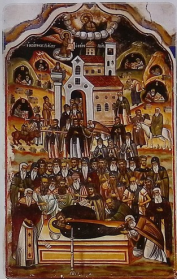
მიძინება წმიდა ეფრემ ასურისა

დამღვეით მე ხამარხხა მათსა, საცა გუ- ლითა შემუსრვილნი განისვენებენ; რათა ძე ღვთისამ გამსა მეორედ მოსვლისასა მაპკუროს მეცა და აღმადგინოს მათვე თანა.