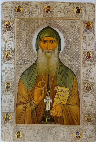
ღირსი გაბრიელი, აღმსარებელი და საღვთო