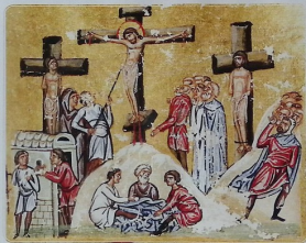
გელათის ოთხთავი. მინიატურა (XII ს.).

ძიების შემდეგ კი, მთელ სამყაროში გა- ისმა მშვიდი და მოსიყვარულე ხმა, რო- მელიც ყველას მოუწოდებდა: „მოვედით ჩემდა ყოველნი მაშვრალნი და ტვირთმი- მენი და მე განგისვენო თქვენ“; „მე ვარ გზა, ჭეშმარიტება და ცხოვრება“; „ხადაც მე ვიყო, მუნცა თქვენ იყვნეთ“. ეს იყო ხმა განკაცებული ღმრთისა – ყველაზე სასურველი და მიუღწეველი სასიძო- სი; გამონხდა იგი, ადამიანური ბუნების განმაახლებული და განმადმრთობელი. ღმერთი გახდა ადამიანი, რათა ადამიანი განიღმრთოს.