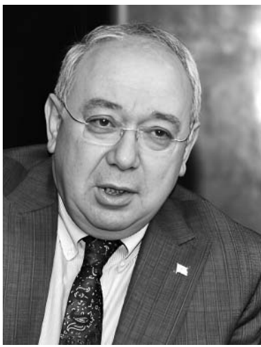
გვესაუბრება სოხუმის სახელმწიფო უნივერსიტეტის რექტორი გ.გ. გოგოლაშვილი:

რწინა, რომ საზღვარსაღმოსავლო ზეზღვრული სოხუმის სახელმწიფო უნივერსიტეტის ქოლზა უნდა ბაზრდღვს, რითაც ჩვენი აზხაზი კმეზის ქართულ საბანანათ-ლველო სივრცეში შემოყვანა ბაცილვებით უზრო ადვილი იქნება. აზხაზი სტუდენტის, მასწავლებლის თბილისში ინტეგრირება უზრო რთული პროცესია, ვიდრე საქართველოში იმ ნაწილთან, რომელიც მას მსაზღვრება — საგვერდ-ლორსთან.