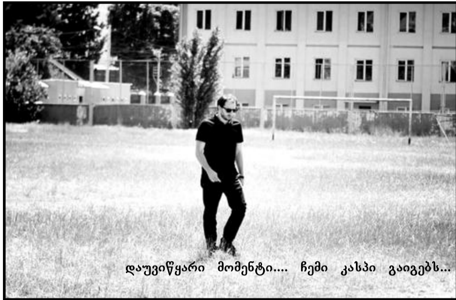
დაუვიწყარი მომენტი.... ჩემი კასპი გაიგებს...

წყალსაცავის საპროექტო მოცულობა იქნება 12.0 მლნ მ 3 , საიდანაც 10,0 მლნ მ 3 ახალი სტადიონისა და პროფსასწავლებლის მშენებლობის პროექტები კასპში საყოველთაო