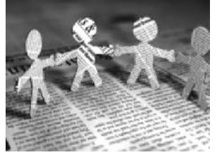
ყოველივეს ერთობლიობა ქმნიდა ცხოვრების გზას, რომლითაც ერიც და ქვეყანაც ღმერთთან მიდიოდა.

კიდევ კარგი, რომ მეხსიერება ინახავს მხოლოდ საუკეთესოს.