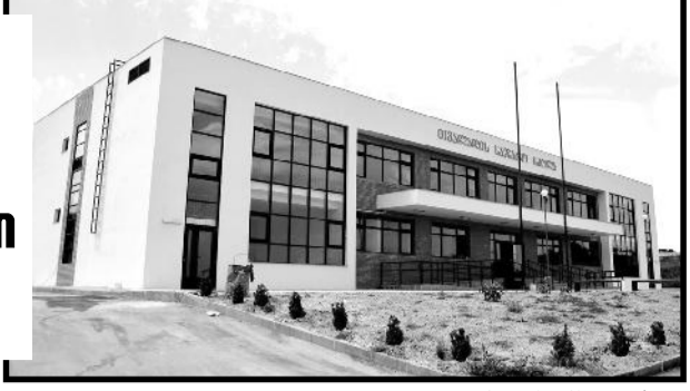
სათვის უკვე საფრთხის შემცველი იყო. ულა, რომლის წევრებიც ქართული ტრადიციული

კასპის მუნიციპალიტეტში დასრულებული და მიმდინარე ინფრასტრუქტურული სამუშაოები შიდა ქართლის მხარის გუბერნატორმა კასა სამხარაძემ დაათვალიერა.