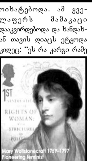
Mary Wollstonecraft 1759-1797 Pioneering feminist

ოიხატებოდა. ამ ყველაფერს მამაკაცი დააკვირდებოდა და ხანდახან თავის დიაცს ეტყოდა კიდევ: „ეს რა კარგი რამეა, გეომეტრიისა და მუსიკის დიდი მცოდნე იყო. ასევე, ქალაქ ჰომპის კედლის მხატვრობას თუ გადავხედავთ, დავინახავთ, რომ მასზე უამრავი ქალი გამოსახული ეტრატებით, კალმებითა და სხვადასხვა ხელნაწერებით ხელში. შეიძლება ითქვას, რომ ძველი რომის ეპოქის შემდეგ ევროპაში ქალთა განათლება გაუმჯობესების ნაცვლად სულ უფრო და უფრო დაკნინდა და უმნიშვნელო გახდა.“