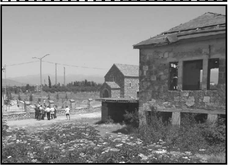
გვერღი მოახაღა ამიჩან ქალანღაქაღ.