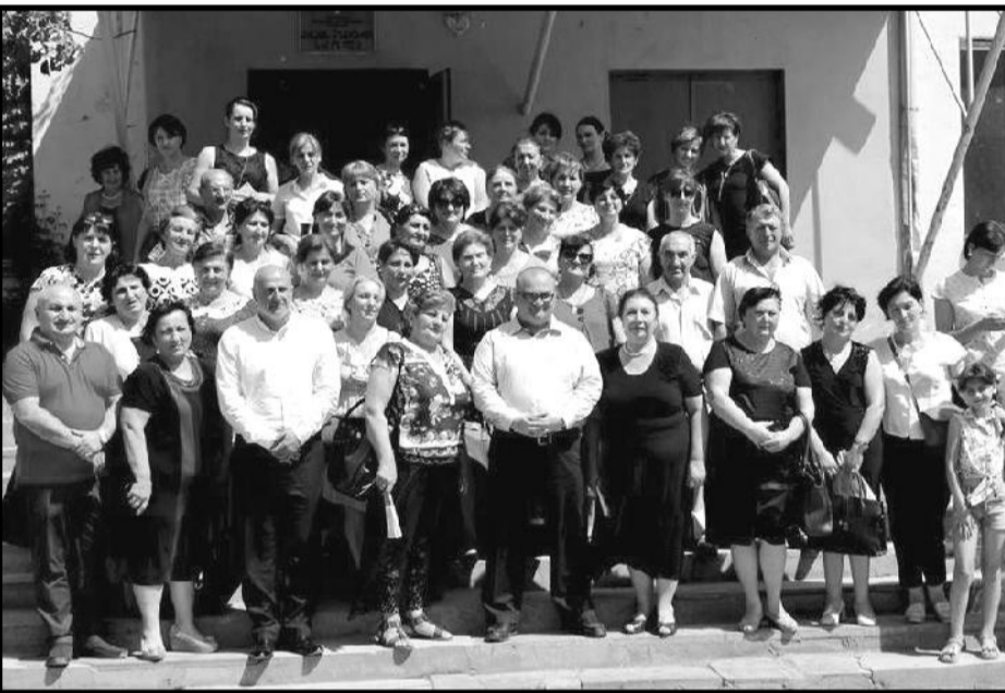
(მშენებლობა დაგეგმილია გოგების შეკითხვებს უპასუხა - მათ კი შეხვედრისა და საინტერესო რომელიც პროფესიულ სიახლეების გაცნობი-

სკოლის მიმდინარე სამუშაოები, შემდეგ კი მუნიციპალიტეტის საჯარო სკოლების პედაგოგებს შეხვდა.