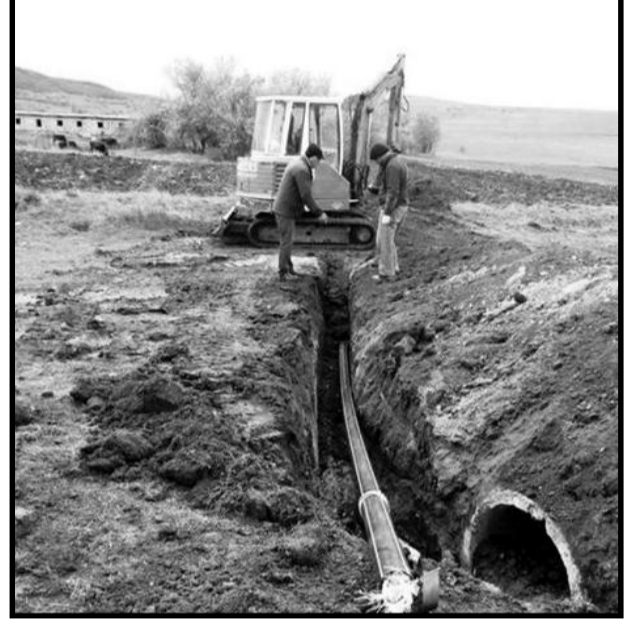
სარემონტო სამუშაოების დასრულება. 7883 ლარის მოგვარებაა, გამოყოფილი თანხის რაოდენობის ფარგლებში.

გლებში. განხორციელებული პროექტებით სარგებელს უწინარესად ადგილობრივი მოსახლეობა იღებს, რაც მათ სოციალური პირობების გაუმჯობესებას ემსახურება. კოდისწყაროს ადმინისტრაციულ ერთეულში მიმდინარეობს პროექტის კასპის მუნიციპალიტეტის სოფელ ნიგოზაში და ჩობალაურში სასმელი წყლის ქსელის რეაბილიტაცია სატუმბო სადგურის მოწყობით და სოფელ სამთავისში არსებული სატუმბო სადგურის რეკონსტრუქციისა და გამორიცხველიანების სამუშაოები, რომელსაც შ.პ.ს. "ნდს მშენებლობა" ახორციელებს და რომლის ღირებულება 289 770 ლარია. პროექტის დასრულება სასმელი წყლით უზრუნველყოფს სოფლების: ჩობალაურის, ნიგოზას, ზემო და ქვემო რენეს მოსახლეობას - რომელთაც ამ მხრივ პრობლემა აქვთ - აღნიშნა კასპის მუნიციპალიტეტის გამგებელმა გოჩა გონიტაშვილმა.