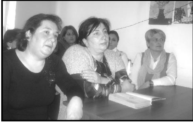
ილია გააცნო ირმა გზირიშვილმა.