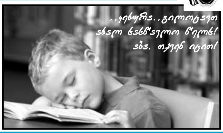
...ყბურის... გილოცავთ სხალო წასწავლოთ წ'ელოს! სხა, თქვენ იცით!

განთიარით წასწავროვი სტოქმარჩი ბავშვობაში ნათქვამი .. ფრთიანნი ფრთხები.. მთელი ცხ- ოფრჩება ალომავებენ მოგონებებს. იხინი რამწას- ფრჩებულოცო იყვებენ ვრც- ილოს თვხაზურ .. თქროს ფონრში.. თაობირას თაობას ვარც- ეცემიან რა ყვროს შინაფ- რყოლი თავფრთილოთის მთავარჩი წას- ალონო წასმ- ბობნი ბრები- ან. შვინახტი თქვინი ბავშ- ვობის წაინ- ცეფრჩესო წ'ყოთები ხეგნს რყოზრჩიყვში .. მყვანეფრჩეს.. რა განთიარით წასწავროვი სტოქმარჩი.