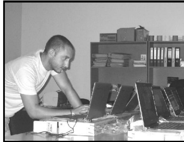
პირველკლასელთათვის განკუთვნილი კომპიუტერული პროგრამების ჩატვირთვა.

საქართველოს განათლებისა და მეცნიერების სამინისტროს მიერ დაწყებულია ორი ახალი სკოლის მშენებლობა. კერძოდ, კასპის ისტორიული №1 საჯარო სკოლის საძირკველზე აშენდება თანამედროვე სკოლის შენობა, რაც დაგვეთანხმებით, მნიშვნელოვანი სიახლე იქნება. ასევე დაგეგმილია სოფელ თვალადის ახალი სკოლის მშენებლობა, ხაზგასმით უნდა აღინიშნოს კასპის მუნიციპალიტეტის გამგებლის ბატონ გონა გოჩიტაშვილის სრული მხარდაჭერა და დახმარება ახალი სკოლების მშენებლობისა თუ სხვადასხვა პრობლემის მოგვარებაში, რისთვისაც მადლობას ვუხდით.