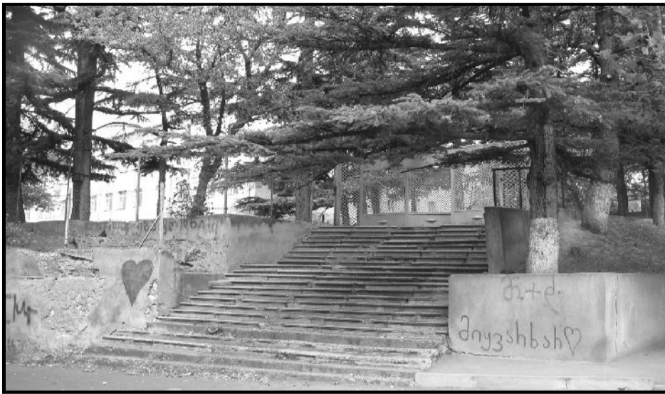
მომენტი, როცა ფიქრები მაინც როგორი იყო

რამეში ჩაღექილია დამუხტული მიკროსამყარო თავისი ბუნებრივი კულტურითა და მორალური კანონით (!). ყოველი დეტალი, სიუ-