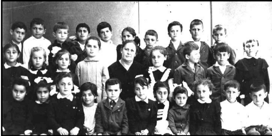
სწავლის დრო, როგორი იყო შენი სკოლა?