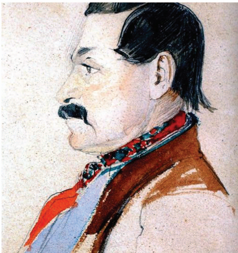
ქართული ლიტერატურის სახელმწიფო მუზეუმი. უცნობი მხატვარი