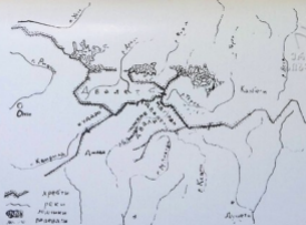
Քաղաքային շրջանը միջին դարերում (մինչև XV դ.)