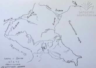
Аланы и Даклы в I в. н.э. локализация по античным данным