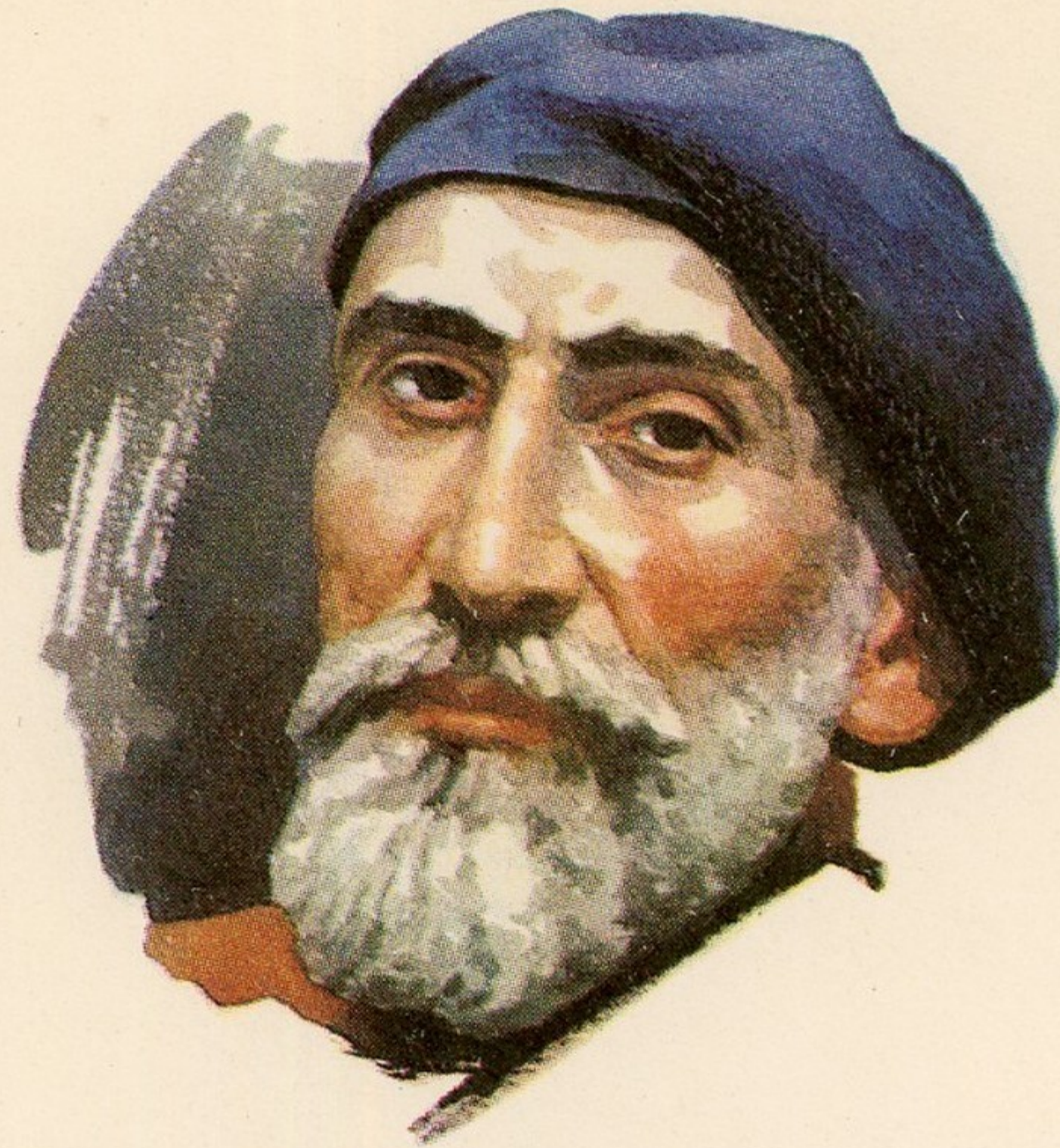
НАРОДНЫЙ ХУДОЖНИК ГРУЗИНСКОЙ ССР СКУЛЬПТОР Я. И. НИКОЛАДЗЕ საქართველოს სსრ სახალხო მხატვარი მოქანდაკე ი. ი. ნიკოლაძე 1876—1951