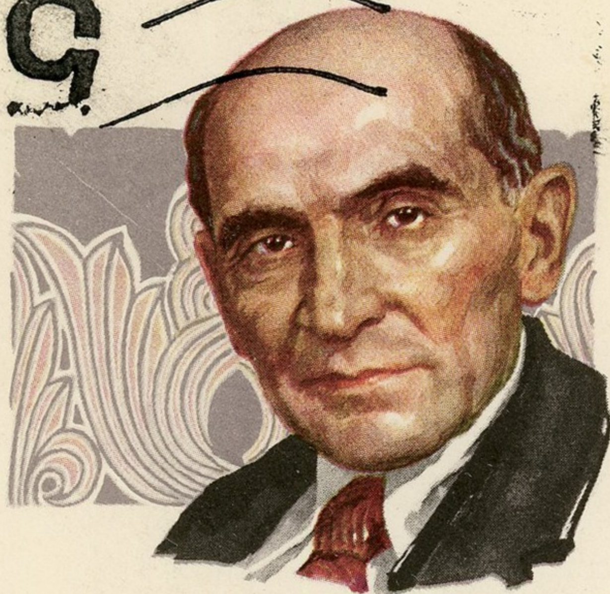
Армянский советский писатель Д. К. ДЕМИРЧЯН Սովետական գրող Դ. ԴԵՄԻՐՉՅԱՆ 1877 — 1956