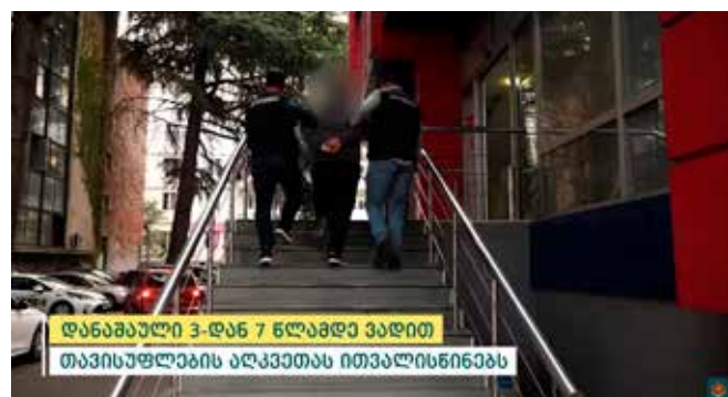
დანაშაული 3-დან 7 წლამდე ვადით თავისუფლების აღკვეთას ითვალისწინებს