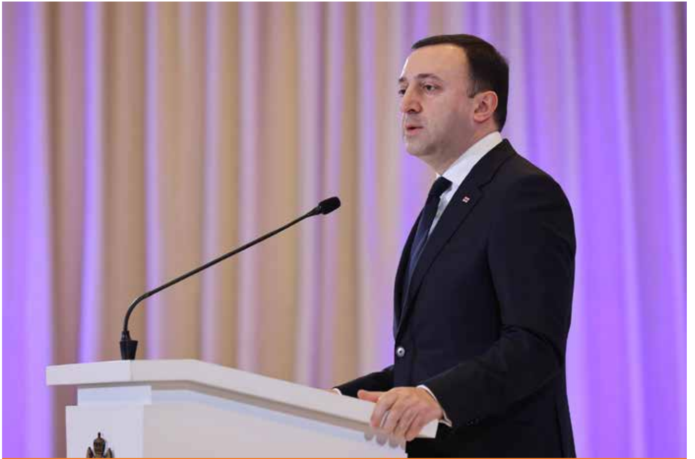
რას გულისხმობს სამშენებლო ამნისტია

„ყველასთვის ცნობილია, რომ საქართველოში მასობრივად არის აშენებული ინდივიდუალური საცხოვრებელი სახლები, რომლებზეც არ გაცემულა მშენებლობის ნებართვა, ან არ არსებობს სამშენებლო დოკუმენტაცია. სწორედ ამიტომ, საჯარო რეესტრის ახალ ამონაწერებში მითითებულია, რომ მიწის ნაკვეთზე განთავსებულია შენობა-ნაგებობები, სამშენებლო დოკუმენტაციის გარეშე, რაც ნიშნავს, რომ საკუთრების უფლება ხარვეზიანია და შესაბამისად, ეს ობიექტები ვერ იქნება სრული მოცულობით ჩაშვებული ეკონომიკურ ბრუნვაში. გარდა ამისა, ამ პრობლემას ასევე უკავშირდება დაჯარიმების ან დემონტაჟის რისკი, რაც