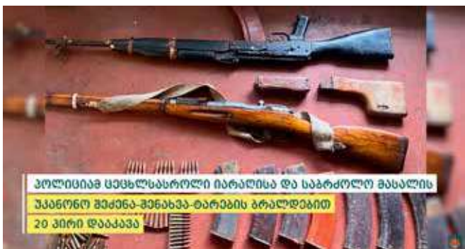
პოლიციამ ცეცხლსასროლი იარაღისა და საბრძოლო მასალის უკანონო შექმნა-შენახვა-ტარების ბრალდებით 20 პირი დააკავა

იმერეთის პოლიციის დეპარტამენტის ხარაგაულისა და თერჯოლის რაიონული სამმართველოს თანამშრომლებმა, სხვადასხვა დროს ჩატარებული ოპერატიული ღონისძიებებისა და საგამოძიებო მოქმედებების შედეგად,