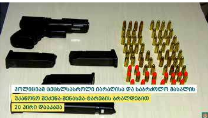
პოლიციამ ცეცხლსასროლი იარაღისა და საბრძოლო მასალის უკანონო შექმნა-შენახვა-ტარების ბრალდებით 20 პირი დააკავა

ცეცხლსასროლი იარაღისა და საბრძოლო მასალის უკანონო შექმნა-შენახვისა და ტარების ფაქტზე გამოძიება, საქართველოს სისხლის სამართლის კოდექსის 236-ე მუხლის მე-3 და მე-4 ნაწილებით მიმდინარეობს.