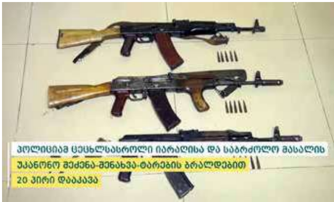
პოლიციამ ცეცხლსასროლი იარაღისა და საბრძოლო მასალის უკანონო შექმნა-შენახვა-ტარების ბრალდებით 20 პირი დააკავა

თბილისის პოლიციის დეპარტამენტის საგამოძიებო მთავარი სამმართველოს და დეტექტივების (ოპერატიული) მთავარი სამმართველოს თანამშრომლებმა, სხვადასხვა დროს ერთობლივად ჩატარებული ღონისძიებების შედეგად, ცეცხლსასროლი იარაღის და საბრძოლო მასალის უკანონო შექმნა-შენახვისა და ტარების ბრალდებით სამი პირი – 1972 წელს დაბადებული ჯ.მ., 1981 წელს დაბადებული ლ.ა. და 1984 წელს დაბადებული ზ.მ. დააკავეს.