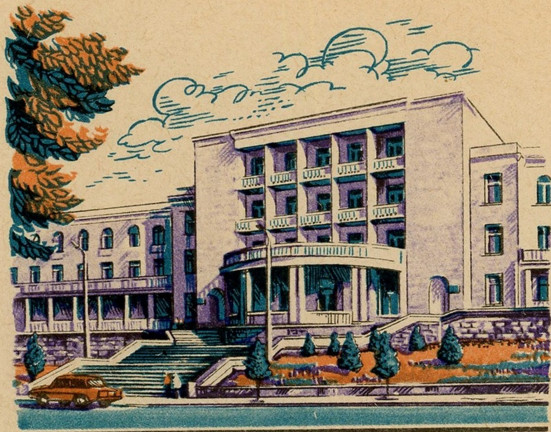
Грузинская ССР. Цхалтубо. Пансионат „Саване“ საქართველოს სსრ. წყალტუბო. პანსიონატი „სავანე“

Куда თბილისის თბილისში საქართველოს საზოგადოებრივი კავშირების განყოფილება