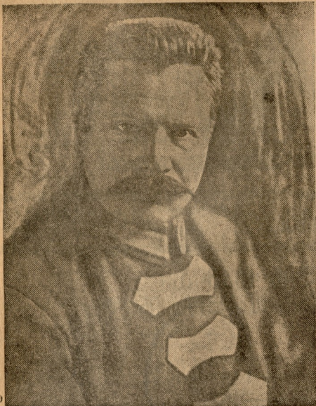
აბს. მ. ვაშინი. 1885—1925 წლები.

წითელი არმიის მერვე წლის თავზე უოველ წითელ არმიელს, მეთაურს და პოლიტმომსახურს არ შეუძლიათ არ გაიხსენონ სახელგანთქნილი წითელი არმიის უღრმოვად დაკარგული ბელადი—მისიმილ მასინი—მ ვაშინი, რომლის ხელმძღვანელობით წითელი არმიამ მიაღწია ძველ-გამოსილებასა და არსებულ ბრძოლის უნარიანობის ამღვლეადაც. ამასთანავე ერთად აბს. მ. ვაშინს ნაკლებად ენერჯის მიუხედავად ჩვენა ჯარის მომავალი აღმშენებლობის ორგანიზაცია—ტრასისტემაზე გადასვლა. წითელი არმია ერთი წუთითაც არ დაიწყებდა თავის ბელადს და საბოლოო გამარჯვებამდე მიიყვანა მის დაწყებულ საქმეს.