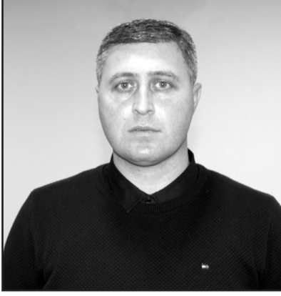
ჯემალ ისაკაძე, საკრებულოს თავმჯდომარის მოადგილე