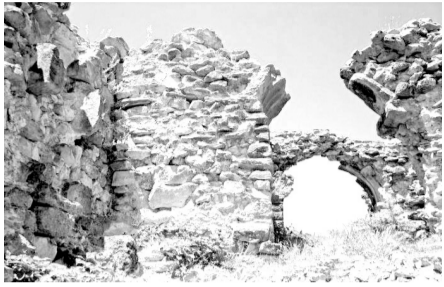
„არს მთის კალთას, სკანდას, სასახლე მეფეთა და ციხე დიდი, დიდშენი“ ვახუშტი ბაბრათიონი