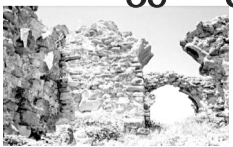
„არს მთის კალთას, სკანდას, სასახლე მეფეთა და ციხე დიდი, დიდშენი“ ვახუშტი ბაბრათიონი

2021 ფინიშის სწორზე გავიდა, არ დაგავიწყდეთ ჩვენი გაზეთის გამოწერა 2022 წლისათვის!