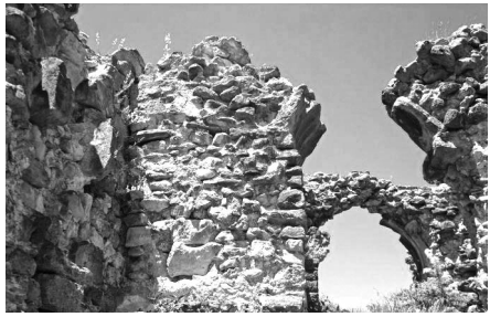
„არს მთის კალთას, სკანდას, სასახლე მეფეთა და ციხე დიდი, დიდშენი“ ვახუშტი ბაგრატიონი