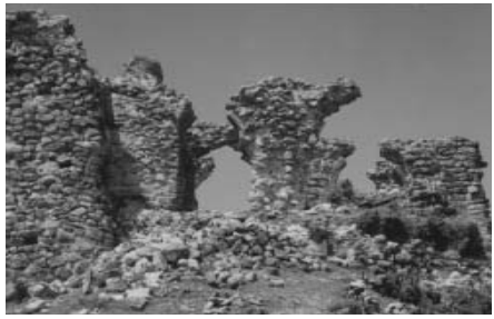
„არს მთის კალთას, სკანდას, სასახლე მეფეთა და ციხე დიდი, დიდშენი“ ვახუშტი ბაბრათიონი