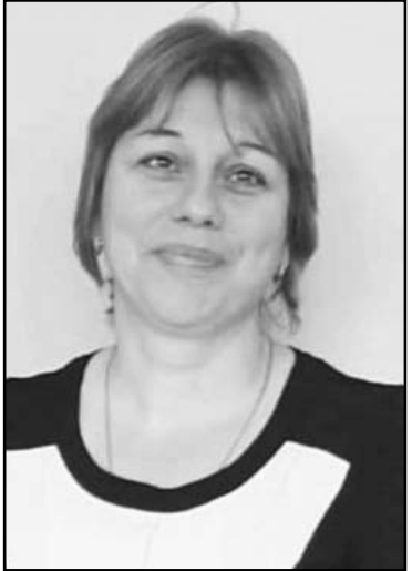
ტივს, ისლა დაგვრჩენია, ვილოცოთ შენს ლამაზ სულზე. ალალი იყოს ის მიწა, რომელიც გულზე დაგეფინა. იძინე მშვიდად, ჩვენო თბილო და ტკბილო მეგობარო! გოდოგინის საჯარო სკოლის პედაგოგიკტივი