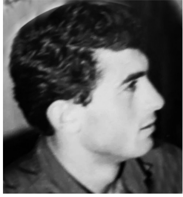
ზურაბ ბოცვაძე - 80

გამორჩენილ ქართველ მეცნიერს, ლიტერატურის ისტორიკოსს და პუბლიცისტს, პროფესორ ზურაბ ბოცვაძეს 80 შეუსრულდა.