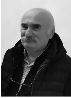
საქართველოს მწერალთა კავშირი

კიდევ ერთხელ გულითადად გილოცავთ საიუბილეო თარიღს სამშობლოს სამსახურში დახარჯულ შემოქმედსა და მოღვაწეს, გისურვებთ დიდხანს სიცოცხლეს, ჯანმრთელობას და თქვენი ყველა სანუკვარი ოცნების განხორციელებას.