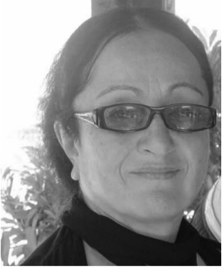
საქართველოს მწერალთა კავშირი

კიდევ ერთხელ გულითადად გილოცავთ საიუბილეო თარიღს გამოჩენულად საინტერესო და მნიშვნელოვან შემოქმედს. დიდხანს სიცოცხლეს, ჯანმრთელობას და ახალ შემოქმედებით წარმატებებს გისურვებთ.