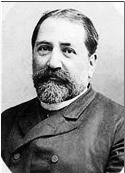
ამის დაწყებამდე ერთ ძველ ანგლოტი გავისხნებ.