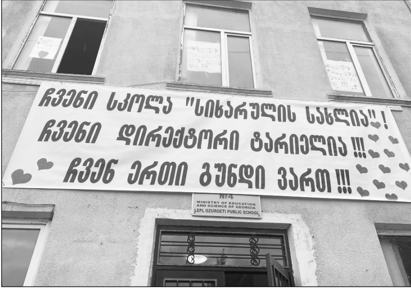
ქ. ოზურგეთის №4 საჯარო სკოლის დირექტორის მოვალეობის შემსრულებლად ტარიელ კალანდაძე რჩება.

16 ოქტომბერს, სკოლის სამმართველო საბჭომ განათლების სამინისტროს მიერ შემოწმებული კანდიდატის სათუნა ლომთაძის დირექტორად არჩევაზე უარი უთხრა. მან 13 ხმითან მხროლობით ერთი ხმა მიიღო.