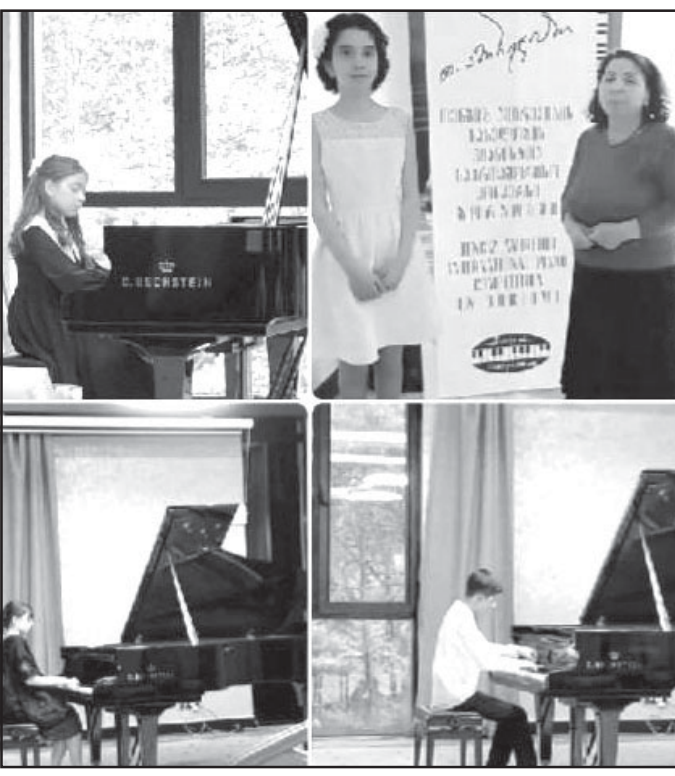
მუშეგარი, რაც ნამდვილად საამაყოა ჩვენთვის. ● პირადად თქვენ როგორ შეფასებდით ჩვენი ადგილობრივი მუსიკალური სკოლის მოსწავლეებს?

- თორის ყველა წევრი აღფრთოვანებული დარჩა ასეთი უმაღლესი საშემსრულებელი დონით და მათ ერთხმად აღნიშნეს ქართველი მუსიკოსი პედაგოგების უდიდესი და არაჩვეულებრივი ნა-