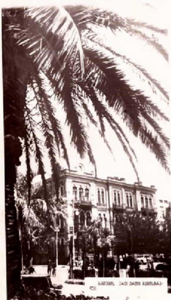
ბათუმის ქალაქის პანორამა