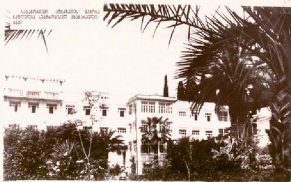
საქართველოს „მშენებლის“ შტაბი საქართველოს სახელმწიფო მშენებლის საბჭო

ამთავრებით აღნიშნული ახალი მშენებლობის პროექტს ახალ ეტაპზე. მისი განსაკუთრებული თვისება ის არის, რომ აქვს ორი მთავარი მახასიათებელი ზონა: ზღვისპირა—100-140 მეტრ სიმაღლეზე და მდინარე მთისა—800-1000 მეტრზე ზღვის დონიდან. ამ მახასიათებელს ხელს ამ გამოყენებულ იქნეს კომპლექსური მშენებლობა ზღვისა და მთის კუთხით.