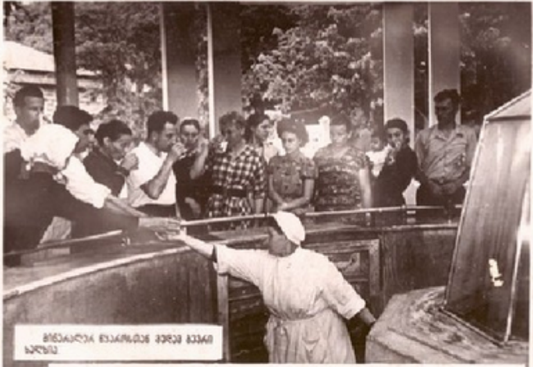
მთაწმინდა მთიანეთის მხარეში სამსახურისათვის

ესი მთაწმინდა სიმაღლეზე ზღვის დონიდან თხადაცხრამეტი სართულიანი, კავკასიონის სამხრეთ კალთებზე, მარაღმდენი ნივთიან მასივზე მდებარეობს ქართული ბოჯომი. მსოფლიო სახელი მას გაუთქვამს ნახშირბადი-ჰიდროქარბონატ-ნახშირბადიანი მინერალიზაცია წყაროებმა. ბოჯომის წყალი თავისი შემადგენლობით ჰგავს საუკანმეთის ქაროვს უიხის წყალს. მთაწმინდა მთიანეთის უკეთესია, რას იხილთ აიხსნება, რომ ბოჯომის წყალში არის იორმინი მარილები, დიდარ მინერალიზაცია ახაეთი ბოჯომის ჯგუფის ქაროვები — ნაწილი, მთი, დიბანი, ჰაზარა მთი, ბაქარანი და სხვები. რომლებში 1020—1654 მთაწმინდა მდებარეობს ზღვის დონიდან.