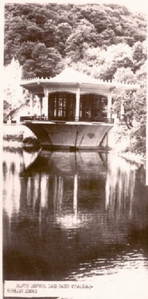
პავლიანის პარკის კარიბჭის ტაძარი 1935 წლის ფოტო