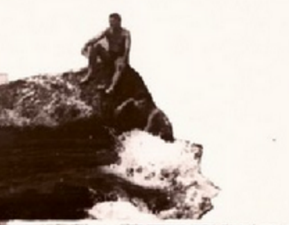
ფრანკილი : სავლილი ფოტოგრაფილი