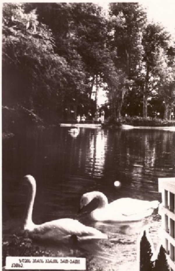
სწავლის დროს სწავლის დროს სწავლის

ქართული ბაზაა მთლიან გაშრობის- დაგვიანდა. ჩვენი ქვეყნის ყოველი ქვე- ნილია ჩვენი მთლიანობის მის სადაცმართობისა და დანახვენივე სახელები. არა ჯანსაღადღობა ბანო- ბიუმის.