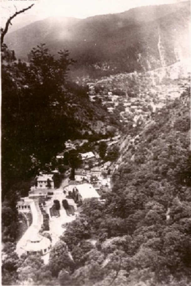
მთაწმინდის სიმაღლე მთიანეთის მხარეში საქართველოს საბავშვო სამსახურის სამსახურისათვის.