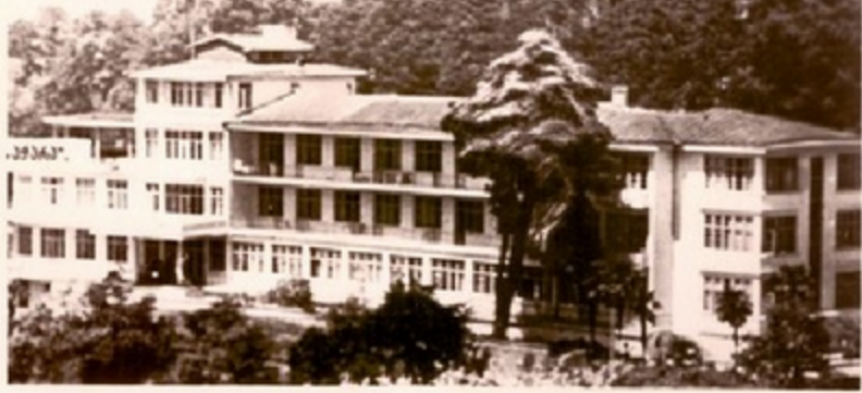
საგარეო ურთიერთობების სამსახური

ზღვისპირა კლიმატური კურორტი ქობულეთი უძველესი საქართველოს ფრანგულ ბაზათს. იგი გაშლილია სანაპიროს კავშირზე შიგნით. თბილისი ზომიერი კლი- მატით, ნაზი სანაპიროსი ჰავით და მშვენიერი კლდეებით.