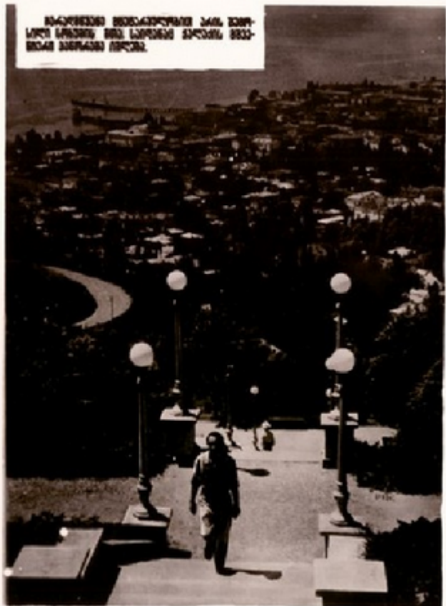
საქართველოს მთავრობის დასაწყისის სახლი და მისი შემოღობვა. მთა შენიშნულია მისი სიმაღლით.