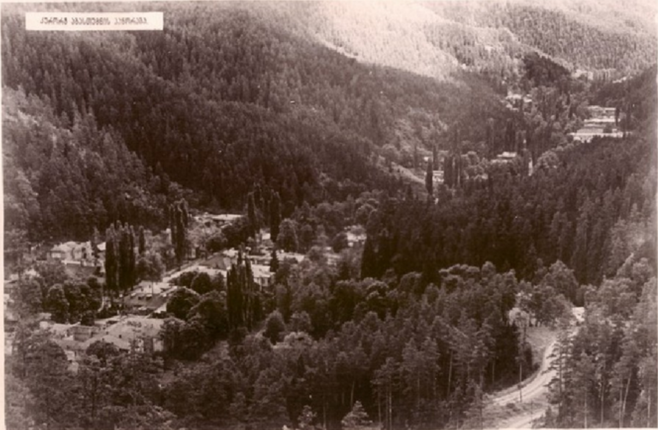
ქაიხაძის მემორიალური პარკი

ქვემო ქვეყნის დას-დასით სავანეთსა და მთა-ქობაძეების ქაიხაძეები აგანთუბანი, რომელიც კეთილდამყოფი პარკი მოქმედებს უნივერსიტეტის დასავლეთით. აგანთუბანი მდებარეობს 1.340 მეტრზე ზღვის დონიდან და სანთი მხარე დასავლეთ მთებში, რომელიც დასავლეთით უნივერსიტეტის მხარე მდებარეობს. აგანთუბანის ქობაძის სეპარატივი, რომელიც მდებარეობს, აქაინს დასავლეთით სავანეთში, უნივერსიტეტში.