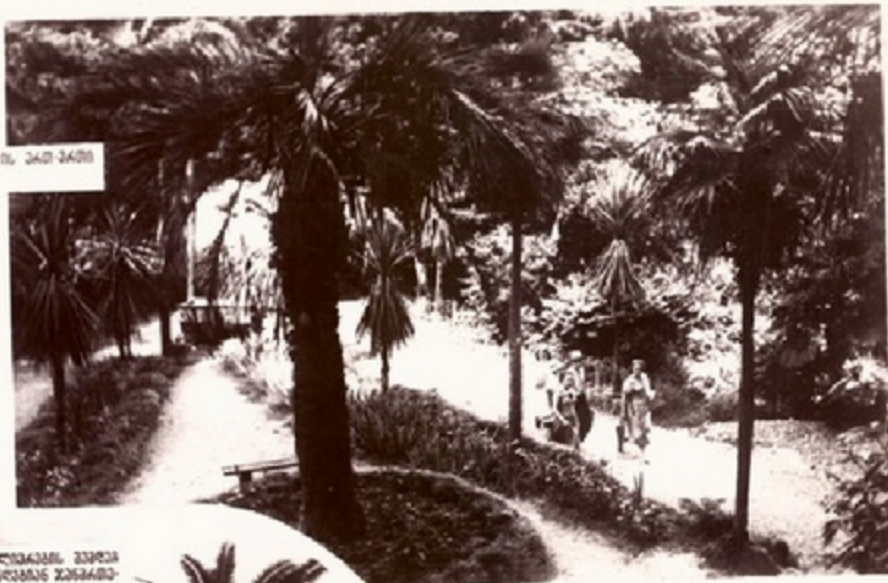
ბიცის დაბნაობის საფარი მრავალჯერ დაბნაობის საფარი.