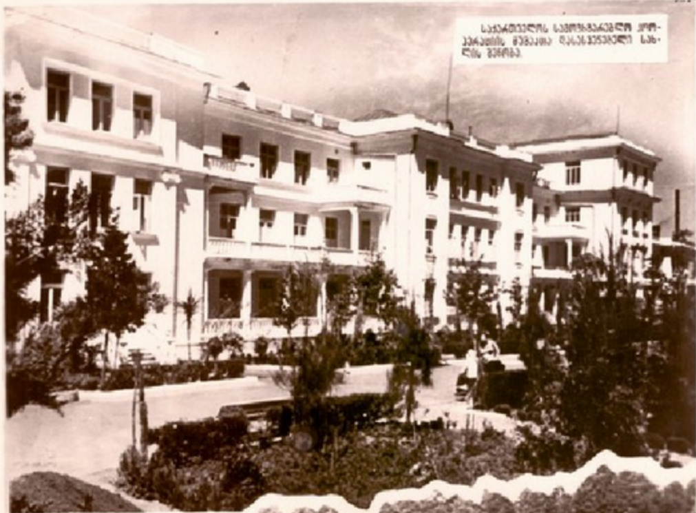
საქართველოს საგარეო ურთიერთობების სამსახურის შენობა რუსეთის საგარეო სამსახურთან