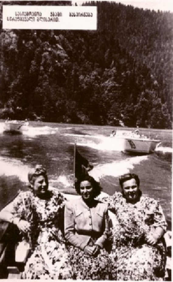
საქართველოში მსოფლიო საგარეო ურთიერთობების სამსახურის წევრები.

მალაილი მთის ზღა კინა საქართველოს შავი ზღვის სანაპიროს ერთ-ერთი ყველაზე ღირსშესანიშნავი პარკია. მთავარ მშენებელია გიორგიანი მთიანეთის შპს. დიდადკინან გვიან საღამომდე ამ ზღაზე დადინან ავტომობილები. მსუბუქი ავტომობილები, რომლებითაც მოგზაურობენ მოქალაქეები და ზაინსები.