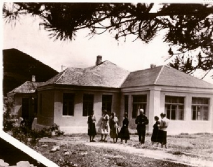
მ. სხვა კომპლექსის სანაბარ მონაბაღი სანაბარ სანაბარ

კუარაზი განთქმულია მსახურის ვიხის მინაბაღაი ხედავით. კომპლესსი იყენებებს სანაბარ და სანაგებარე.