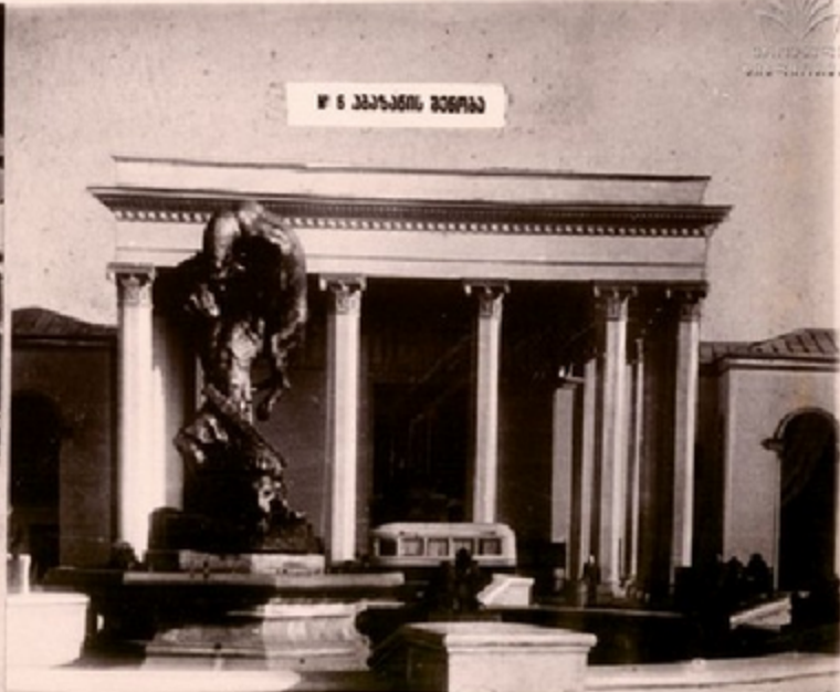
ქ. ს. ურბნის თეატრი