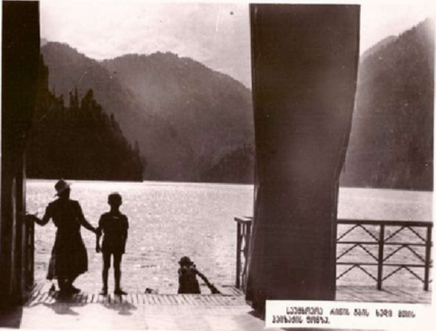
საქართველოში კინა მთის, სავაილი მთის პარკის მთავარი.

მალაილი მთის ზღა კინა საქართველოს შავი ზღვის სანაპიროს ერთ-ერთი ყველაზე ღირსშესანიშნავი პარკია. მთავარ მშენებელია გიორგიანი მთიანეთის შპს. დიდადკინან გვიან საღამომდე ამ ზღაზე დადინან ავტომობილები. მსუბუქი ავტომობილები, რომლებითაც მოგზაურობენ მოქალაქეები და ზაინსები.