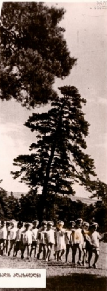
მთიანეთის კავშირის მუშაობა

თბილისის კომუნალური საბაკაუბნო უწყისობის მანქანით ეს მუშაობები სავსებ-კლიმატის სარგებლობის მიზნით ხდებოდა.