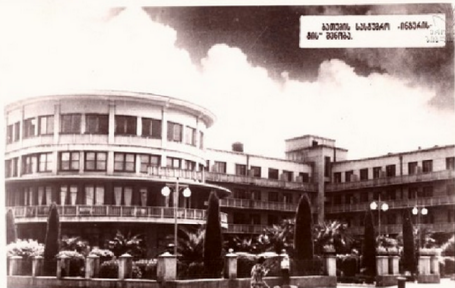
ბათუმის სასტუმრო - 0650400-800 - 2067000

ბათუმში აჭარის ავსტა დელეგაციამ. იგი მსოფლიოთა ავსტათა კომისიას სპეციალურ ქალაქი. კავკასია შუა, თბილ-ზინიანი და კბილი ქლითა ათა-სოფით დასსვენებელს იჭირავენ აქ. ბათუმის ქუჩებს ავსვენებენ საუბსოლო დეკორაციული მწვანე ნაკვეთები.