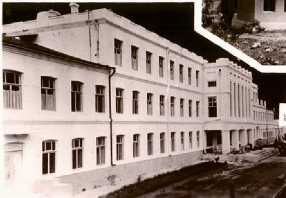
სანაბარის და სანაბარის რაფა სანაბარის კუარაზი მონაბაღი სანაბარ- არ სანაბარის მონაბაღი