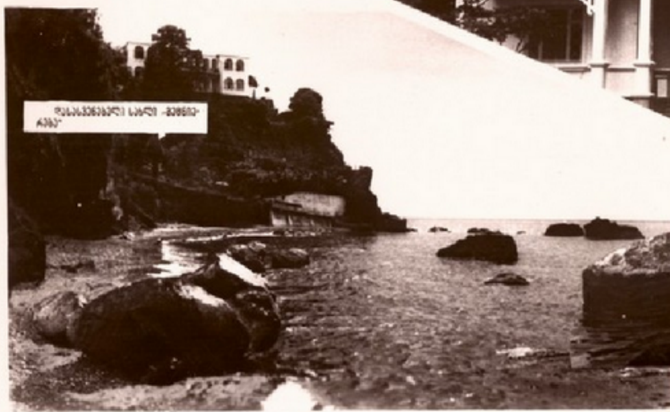
რისსავსეაილი სავლი - მრეგაი- კაი