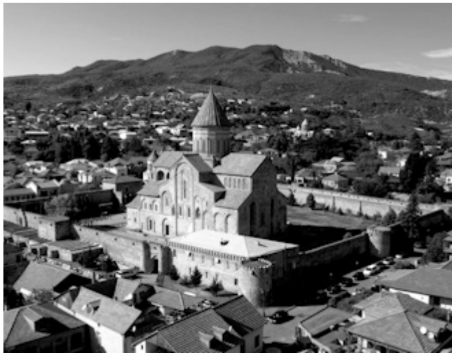
რას უპავშირდება სვეტიცხოვლობა?

სვეტიცხოვლობა იგივე მცხეთობა საეკლესიო დღესასწაულია, რომელიც ყოველწლიურად - 14 ოქტომბერს აღინიშნება. მასთან დაკავშირებით წირვა-ლოცვა მთელი საქართველოს მოქმედ ეკლესიებში აღინიშნება, თუმცა ფოკუსში, ამ დღეს, ქალაქი მცხეთაა. სვეტიცხოვლის დიდ საკათედრო ტაძარში ადგილობრივი და თბილისიდან ჩასული მრევლი მთავარ საზეიმო წირვას ესწრება. სწორედ აქ არის დაფლული იესო ქრისტეს კვართი და მისი სადიდებელი დღესასწაულიც აქედან გამომდინარეობს: “კვართისა საუფლო სა და სვეტისა ღმრთივბრწყინვალისა და მირონმდინარისა”. თავად მცხეთის შუაგულში კი სხვადასხვა გასართობი ღონისძიება იმართება.