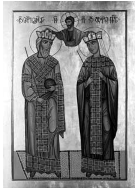
წმინდა მეფე მირიანი და დედოფალი ნანა

ქრისტეს კვართისა და ქართლის გაქრისტიანების სურვილმა, წმინდა ნინო იერუსალიმიდან მცხეთაში ჩამოიყვანა. მან ამცნო მეფე მირიანს უდიდეს სინმინდის შესახებ, რომ სასახლის ბაღში იყო დაკრძალული უფლის კვართი და ილია წინასწარმეტყველის ხალენი. მეფის მირიანის და დედოფალ ნანას მეფობის დროს, წმინდა ნინოს რჩევით, კვიპაროსის ადგილზე ტაძრის მშენებლობა გადაწყვიტეს. მირიან მეფის ბრძანებით, სწორედ ამ ხისგან ეკლესიისთვის 7 სვეტი დაამზადეს, რომლიდანაც