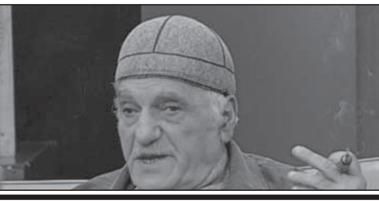
საბრძოლო მადლობის ბრძანებით...