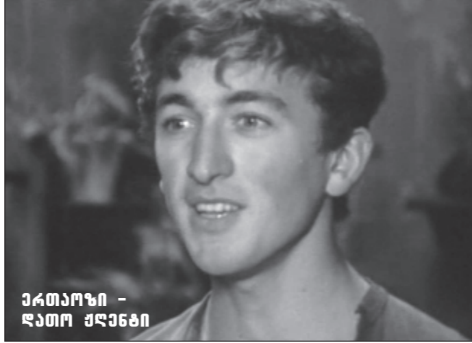
კატორჩი - კატორჩი