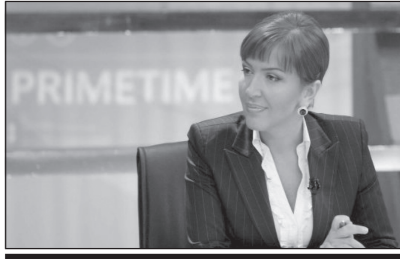
ნინო ბურჯანაძე, საქართველოს განვითარების უწყვეტი...