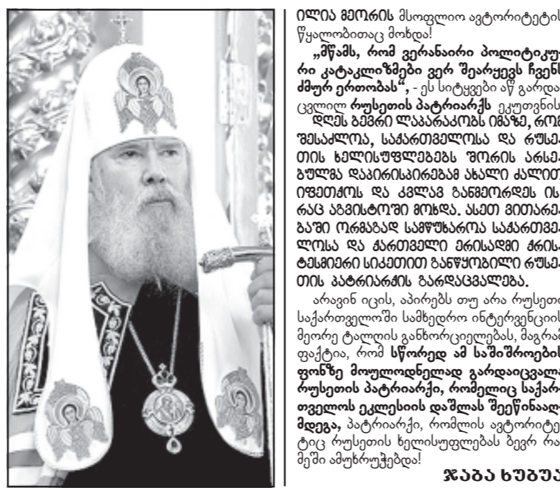
ალექსანდრე მკვიციანი, რუსეთის პატრიარქი...