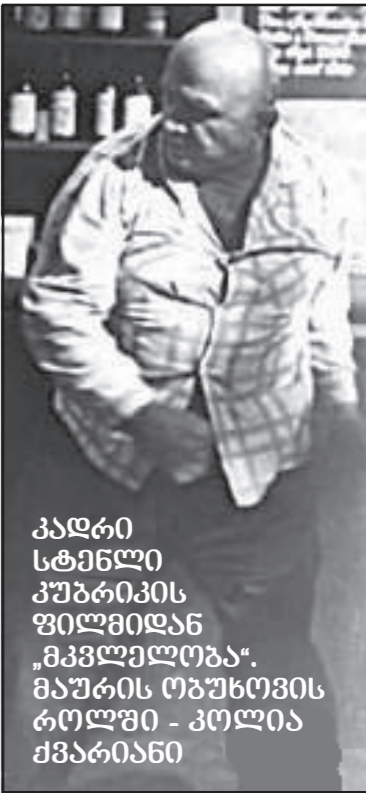
კადრი სტამბლი კუმბრიკის ფილმში "მეგობრობა"