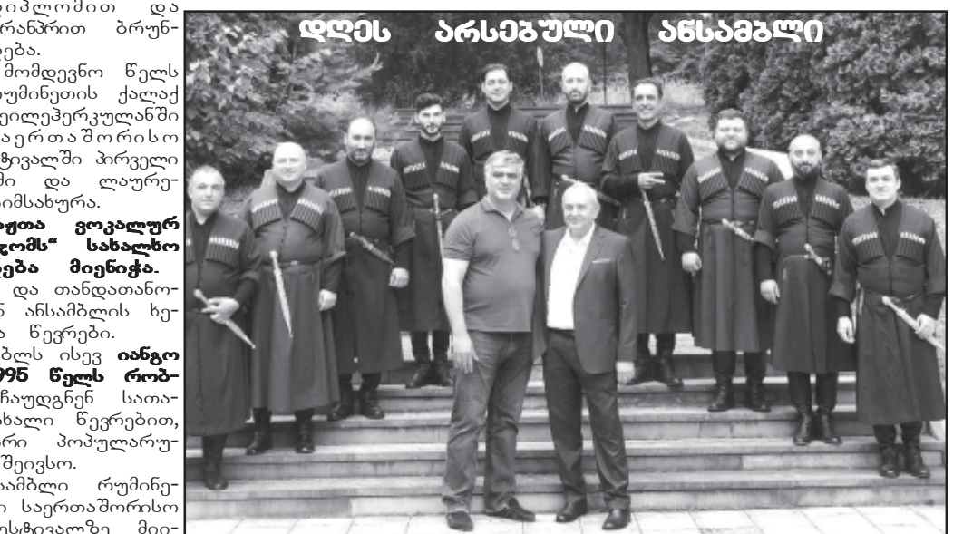
დღეს არსებული ანსამბლი

1980 წელს სახალხო ანსამბლი „ბორჯომი“ საქართველოს ტელევიზიაში მიიწვიეს და ანსამბ-