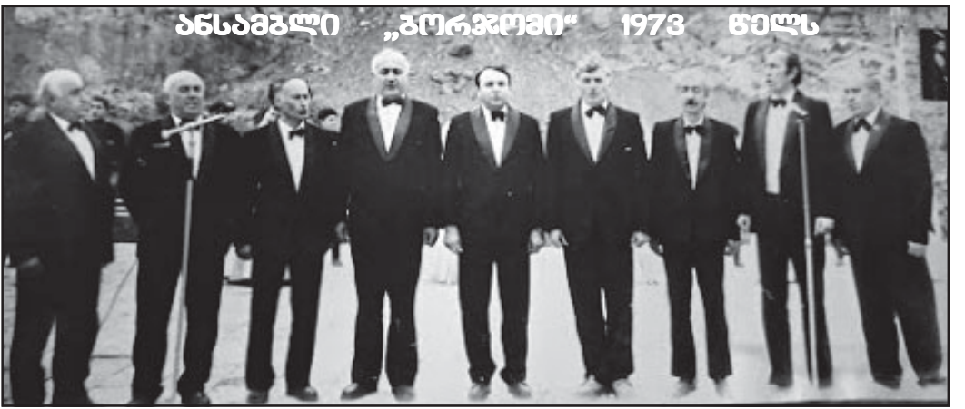
ანსამბლი „ბორჯომი“ 1973 წელს

ლის შესრულებული სიმღერები საარქივო ფონდში შეიტანეს, სწორედ მაშინ პირველად შესრულდა მამია ხატეიის შვილის სიმღერა „თენდება“.