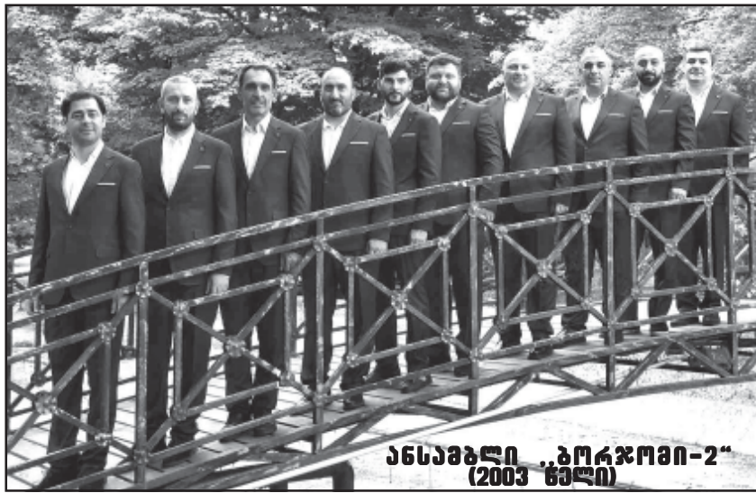
ანსამბლი „ბორჯომი-2“ (2003 წელი)

2015 წელს ანსამბლი ისევ ძველი წევრებისაგან შეიცვალა და უჩა ურჩაძე შეემატა. იმავე წელს