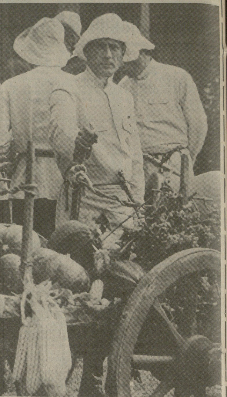
შემოვიდა შემოდგომა ხვანთა და ბარბაქაძე...