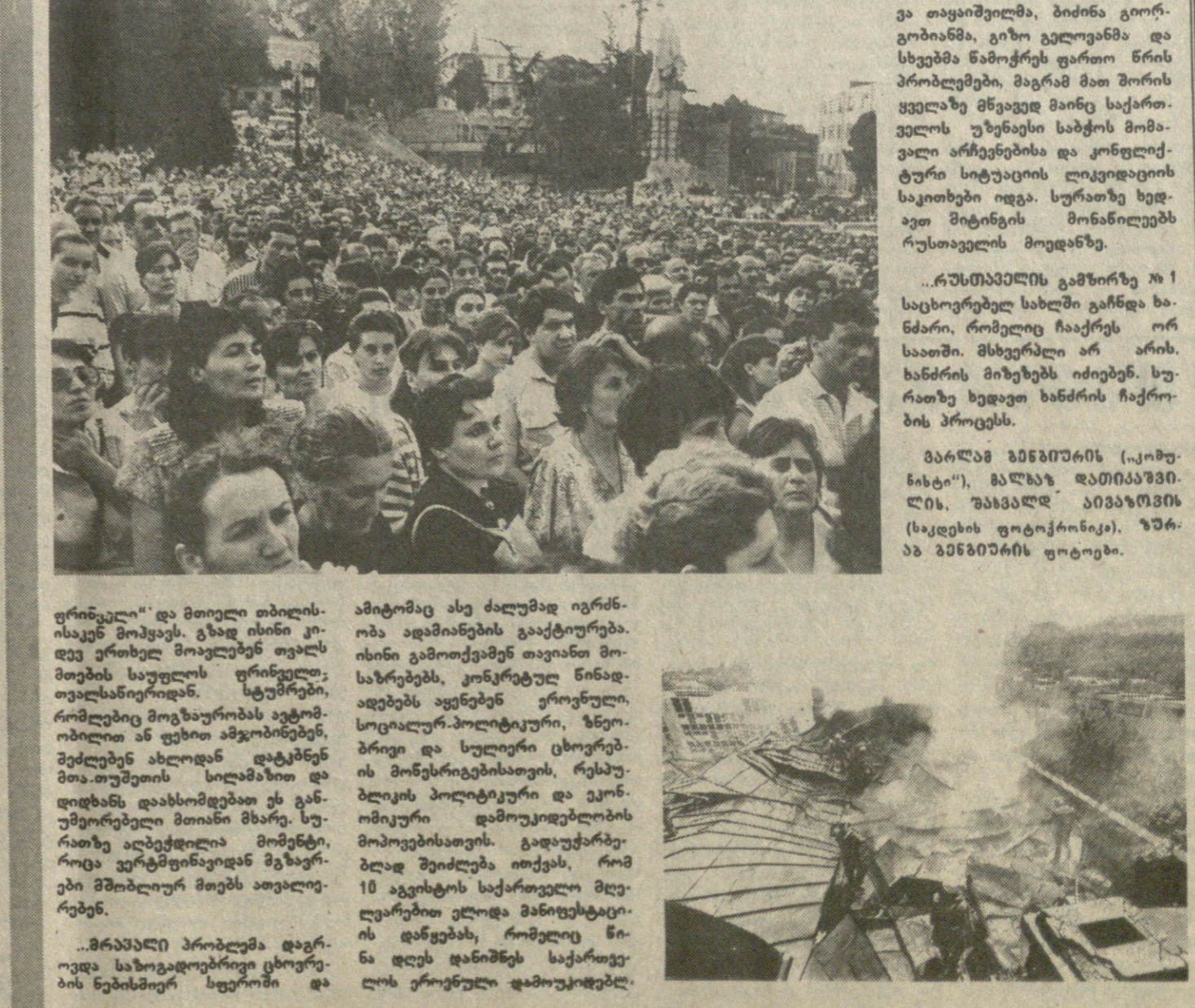
საბჭოთა კავშირის უზენაესი საბჭოს მდივანის ბრძანებულება