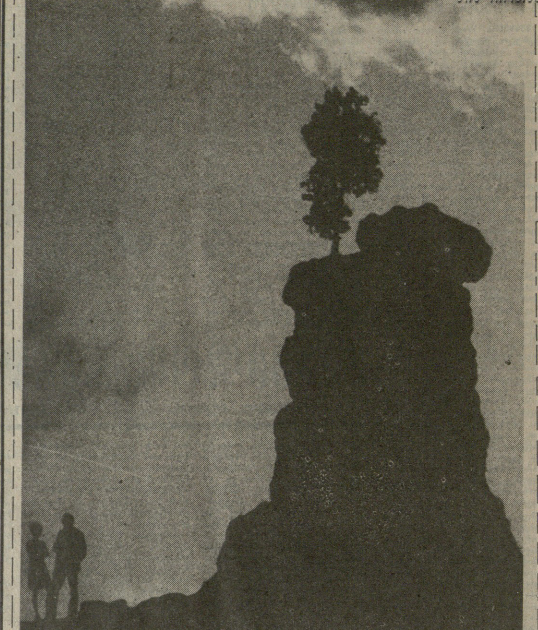
ნაზარაძე ნ. ზურაბ ღაბუაშვილის ფოტოგრაფი.