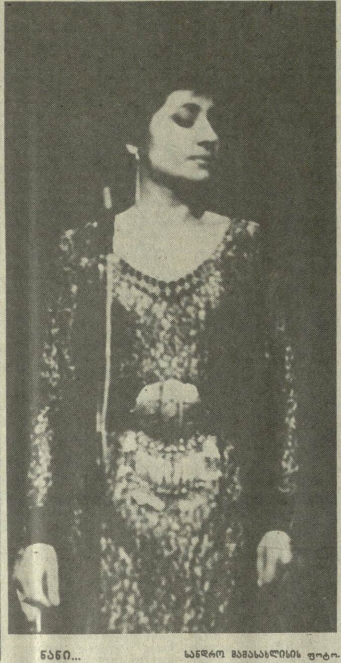
ნანდი... ნანდი მამასხვისი ფოტო.