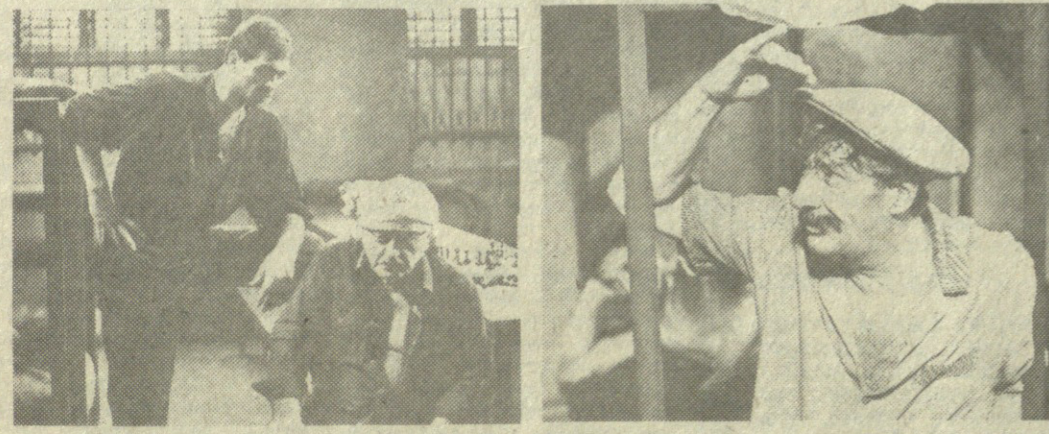
ნანდი მამასხვისი ფოტო.