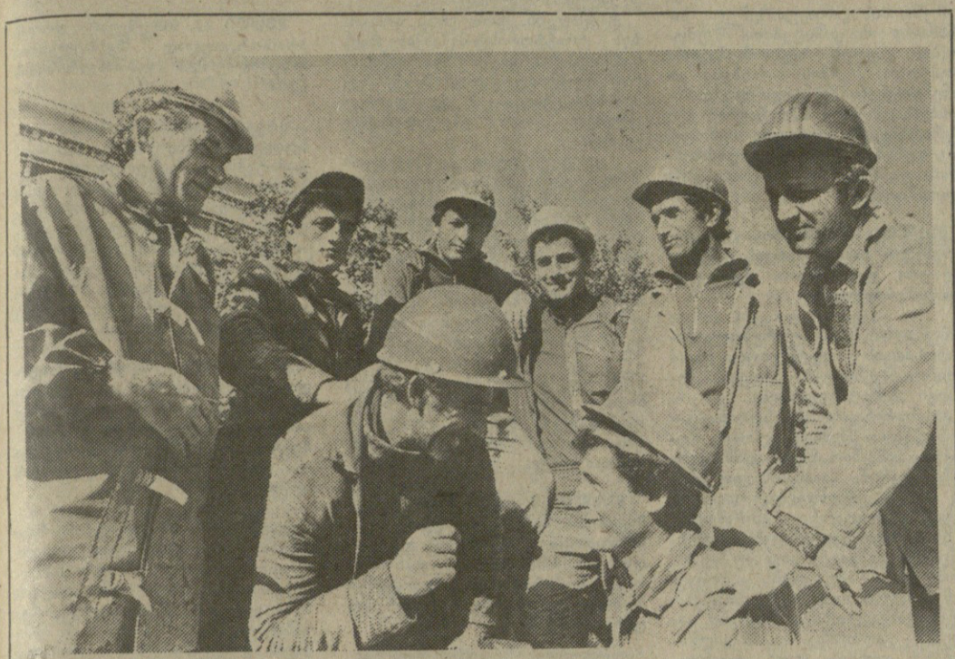
მეტროპოლიტანის ახალი ტრასა

ბრძოლაში თბილისის მეტროს საბურთალოს ხაზის გადგენა. ახალი ტრასის გაშენება — „ხაბარისა“ და „აგა-ფაქელისა“ — „დელისა“ და „ხაბარისა“ სახეობის ავტომატური სისტემების დაყენება. მეტროს მშენებლობის მუშაობაში მონაწილეობენ მშენებლები, მშენებლის ხელისუფლების და საბურთალოს მუნიციპალიტეტის ხელისუფლების წარმომადგენლები. მშენებლობის მუშაობის დასრულების შემდეგ, მეტროს ხაზი დაიხსნება.