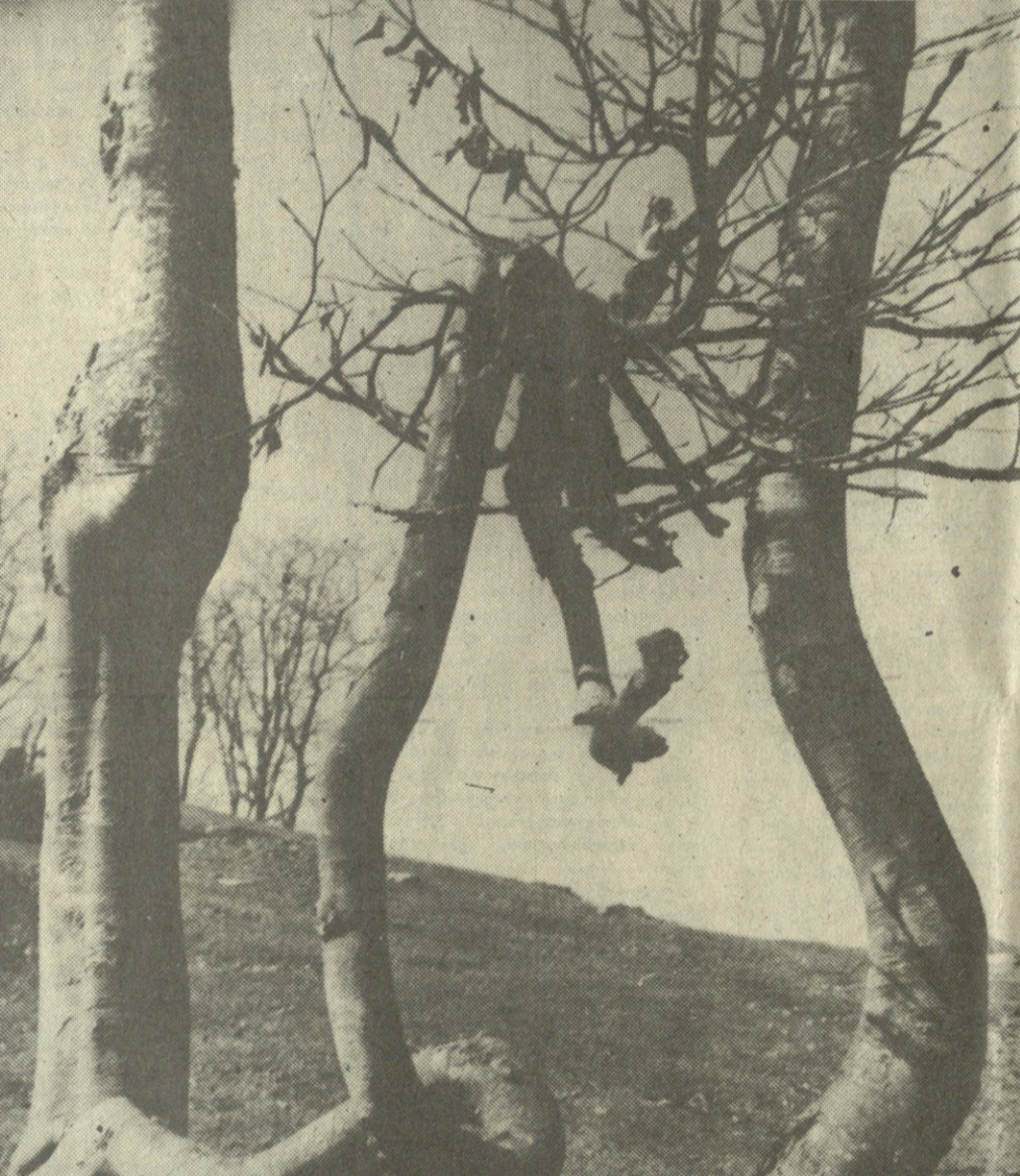
ბუნების სიბრძნეობა და სიყვარული. მისი სიბრძნეობა და სიყვარული ანიჭებს ბუნებას იმდენი ესთეტიკა და პოეზიას, რამდენიც ბუნებაში — ცოცხალსა თუ არაცოცხალში.

გუნება მშვენიერების დაუმრტელებელი წყაროა. არაფერში არ არის იმდენი ესთეტიკა და პოეზია, რამდენიც ბუნებაში — ცოცხალსა თუ არაცოცხალში. დედამიწის ამ განუყოფელ ხიზლს სწორედ სილამაზისა და უსიკვამლო სი უნიკალური შერწყმა ანიჭებს.