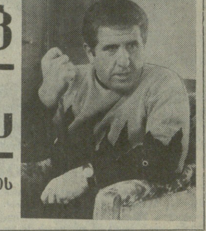
საბჭოთა კავშირის მინისტრთა საბჭოს წევრი...