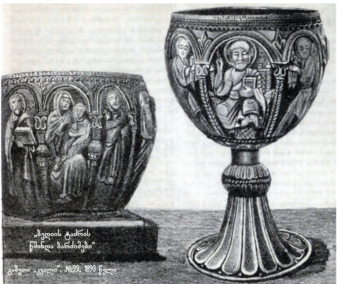
„ბელის ტაძრის წმინდა ბარძიბები“