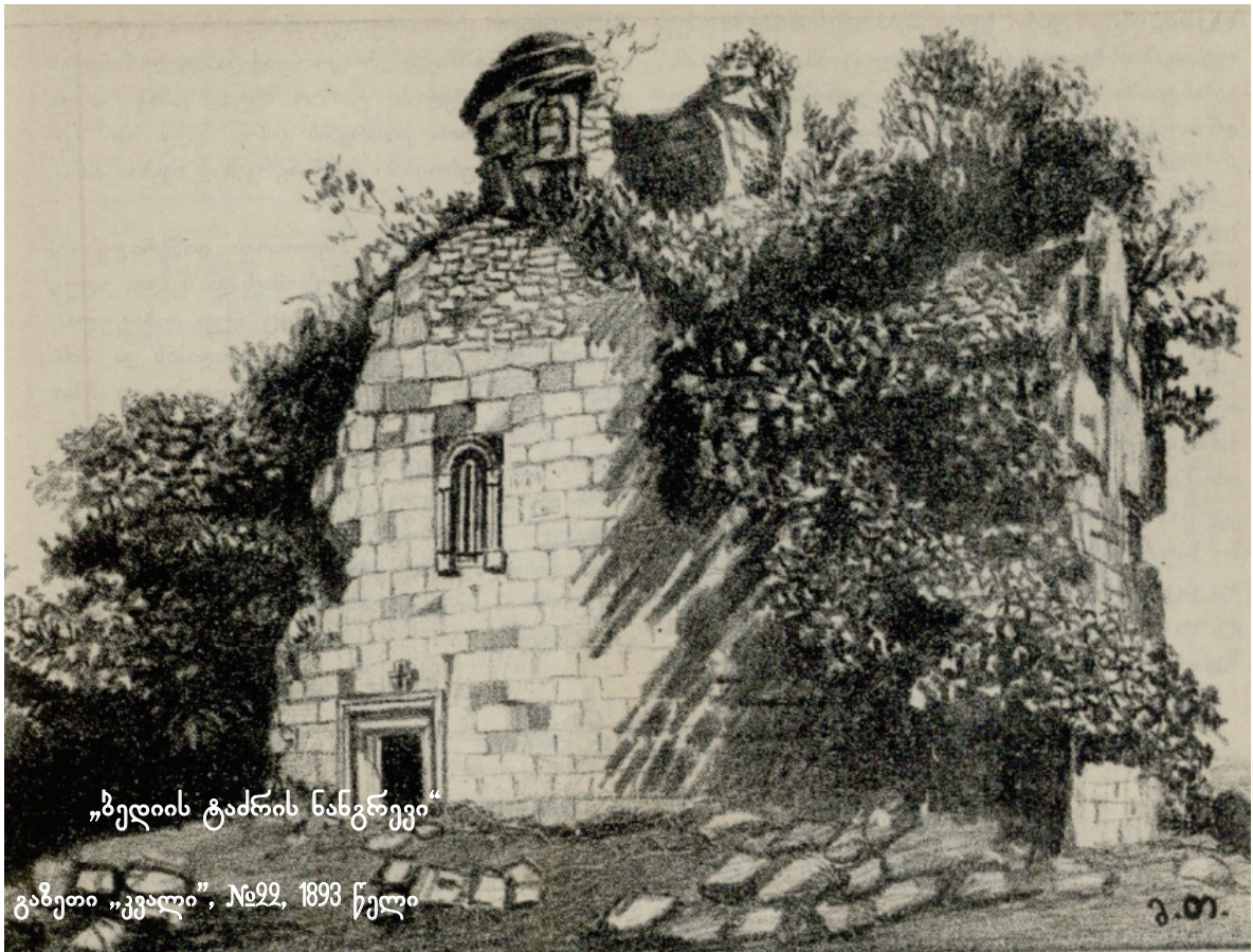
„ბელის ტაძრის ნანგრევი“