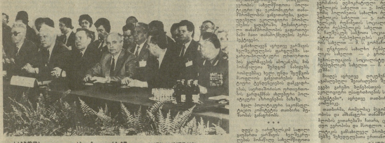
საპარტიო კონგრესის მონაწილე სახელმწიფოთა პოლიტიკური საკონსულტაციო კომიტეტის სხდომა