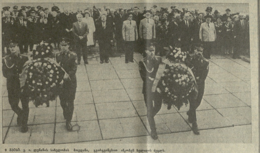
9 მაისი. ვ. ი. ლენინის სახელობის მოედანი, გვირაგინებით ამოხვენი ბელადის ძეგლი.

საპარტიველოს სსრ უმაღლესი საბჭოს და ვინისტრთა საბჭოს ორგანო КОМУНИСТИ — ОРГАН ЦК КП ГРУЗИИ, ВЕРХОВНОГО СОВЕТА И СОВЕТА МИНИСТРОВ ГРУЗИНКОЙ ССР