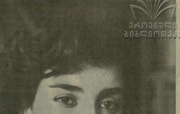
თბილისის „ელექტროსაბავსო“ საწარმოო გაერთიანების მეთაურ ქარხანაში დაწინაურდა აწყობის სამსახურს კლავიატორი...