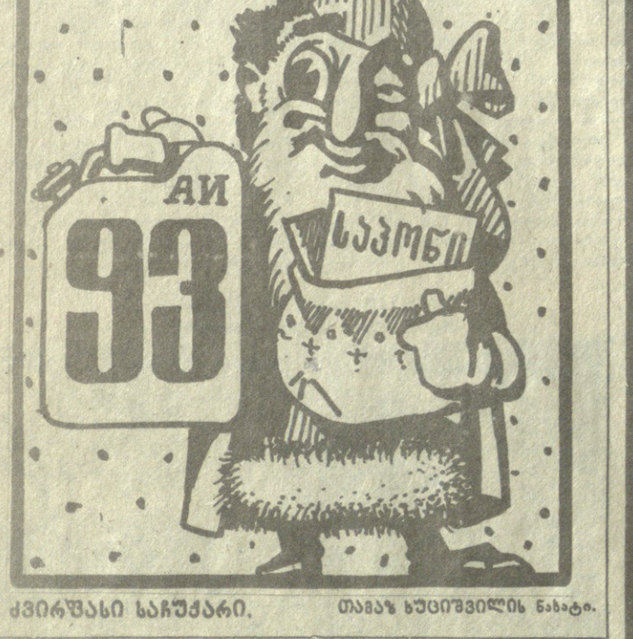
მხატვრის სახალხო დიმილი, თამაზ ხაინძის ნახატი.