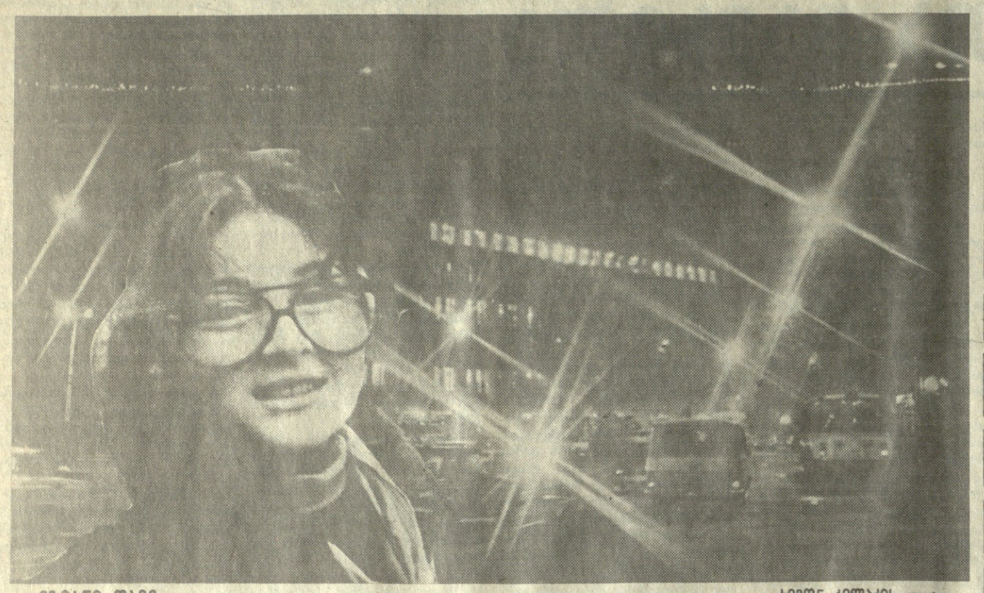
მედიანი ლამი, სიმონ კილაძის ფოტო.