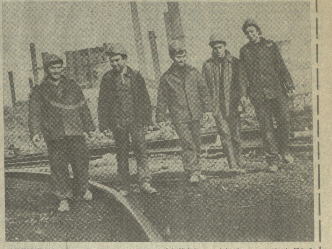
საქართველოს სსრ მინისტრთა საბჭოს წევრები და მათი თანამშრომლები მუშაობენ სახელმწიფო მშენებლობის ობიექტებზე. მათი მუშაობის შედეგად ხალხის ცხოვრების პირობები უწყვეტად უკეთესდება.

გორგაძის მემორიალი — არა მარტო თანამედროვეობის სასარგებლოდ, არამედ ხალხის განვითარებისთვის, რომელიც მისი მემორიალის მიხედვით უნდა განვითარდეს. გორგაძის მემორიალი არა მარტო ხალხის განვითარებისთვის, არამედ ხალხის განვითარებისთვის, რომელიც მისი მემორიალის მიხედვით უნდა განვითარდეს.