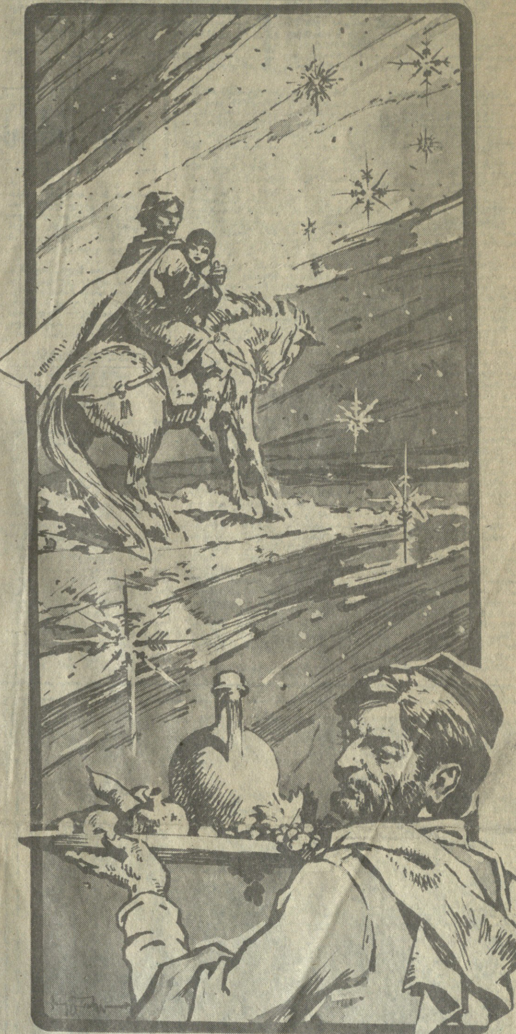
„სასა ხონით მოდის მთავალი, გავხსნათ კარი, გულის კარი, გენერალი ვალიყადი დაგვაგვაროს, დაგვაგვაროს“