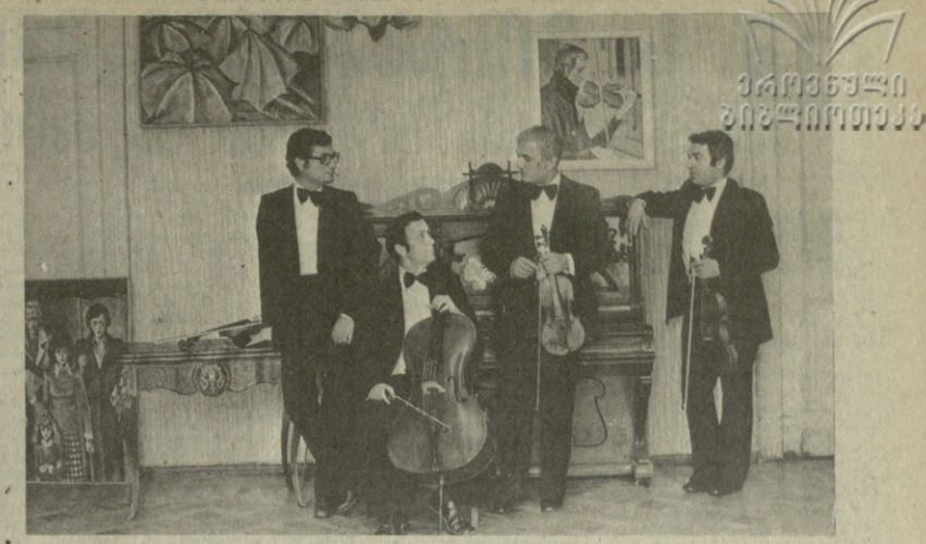
საბჭოთა კავშირის სახელმწიფო სინების კვარტლის მოღვაწეობა ჩვენი მუსიკალური ცხოვრების უნივერსალური მოვლენის განხორციელებაში.

გუგინ, დღეს, სკალ. მ. ს. გორბაჩოვი ამერიკელი სენატორებს და მესწიერებს უთხრა, რომ საქართველოში არსებული მდგომარეობა მათთვის სასარგებლოა.