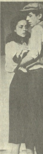
დარგონი მუღამი... მისი უფროსი ძეგლი...