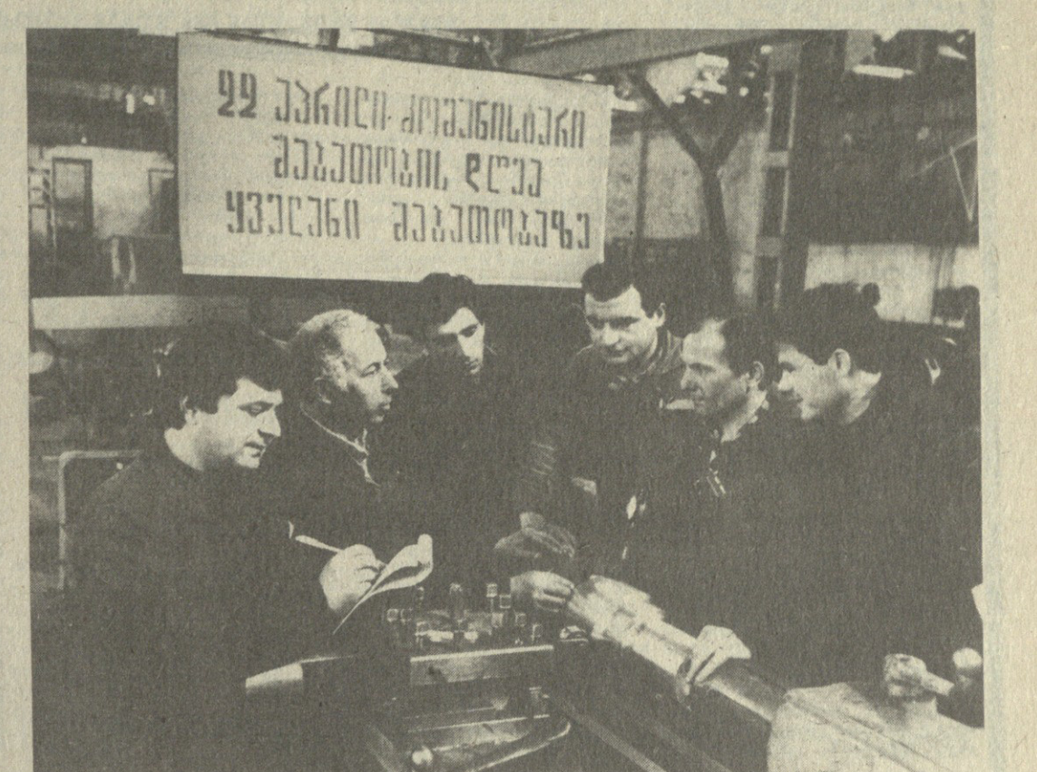
გუგინ ცენტრალური კომიტეტი უზრუნველყოფს პროდუქციის მიწოდებას. გუგინ ცენტრალური კომიტეტი უზრუნველყოფს პროდუქციის მიწოდებას...