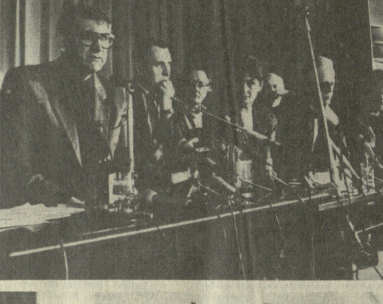
საქართველოს თეატრული ინსტიტუტის დაარსების დასტურება. (Caption describing the inauguration ceremony.)