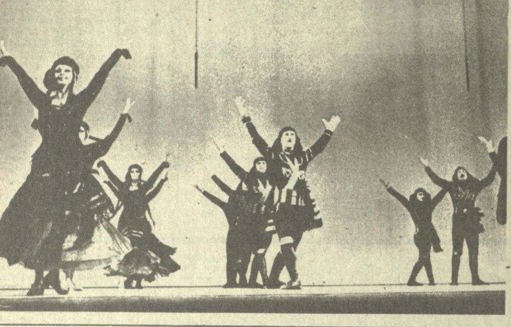
...ანონისი სოლისტების მონაწილეობით