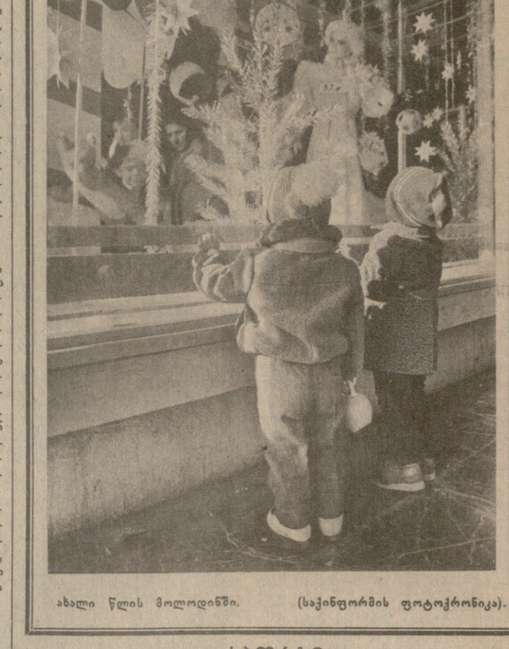
ახალი წლის მოლოდინში. (საქინფორმის ფოტოქრონიკა).

მობრუნდით ჩვენს სახლში! მობრუნდით ჩვენს სახლში! მობრუნდით ჩვენს სახლში! მობრუნდით ჩვენს სახლში!