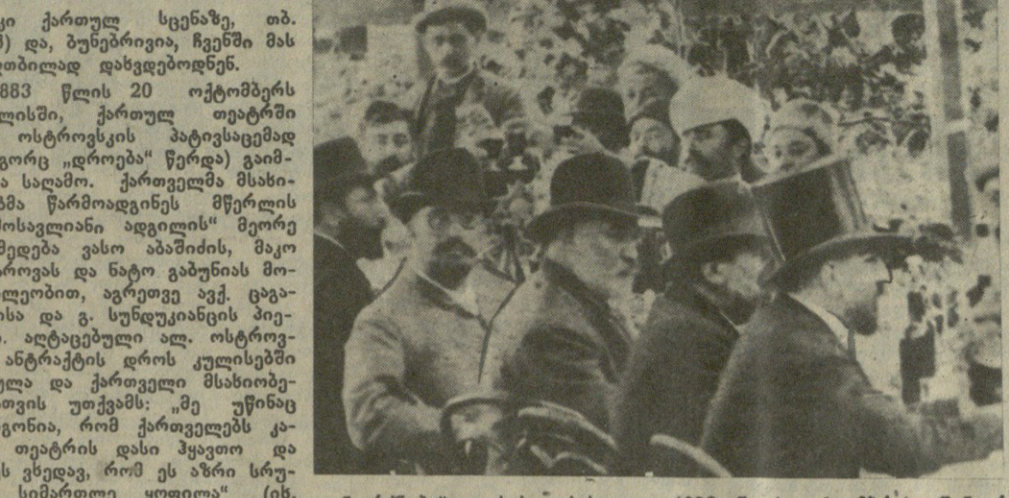
ილია ჭავჭავაძის იკონომბრაფიისათვის