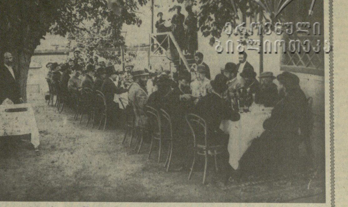
ილია ჭავჭავაძის იკონომბრაფიისათვის