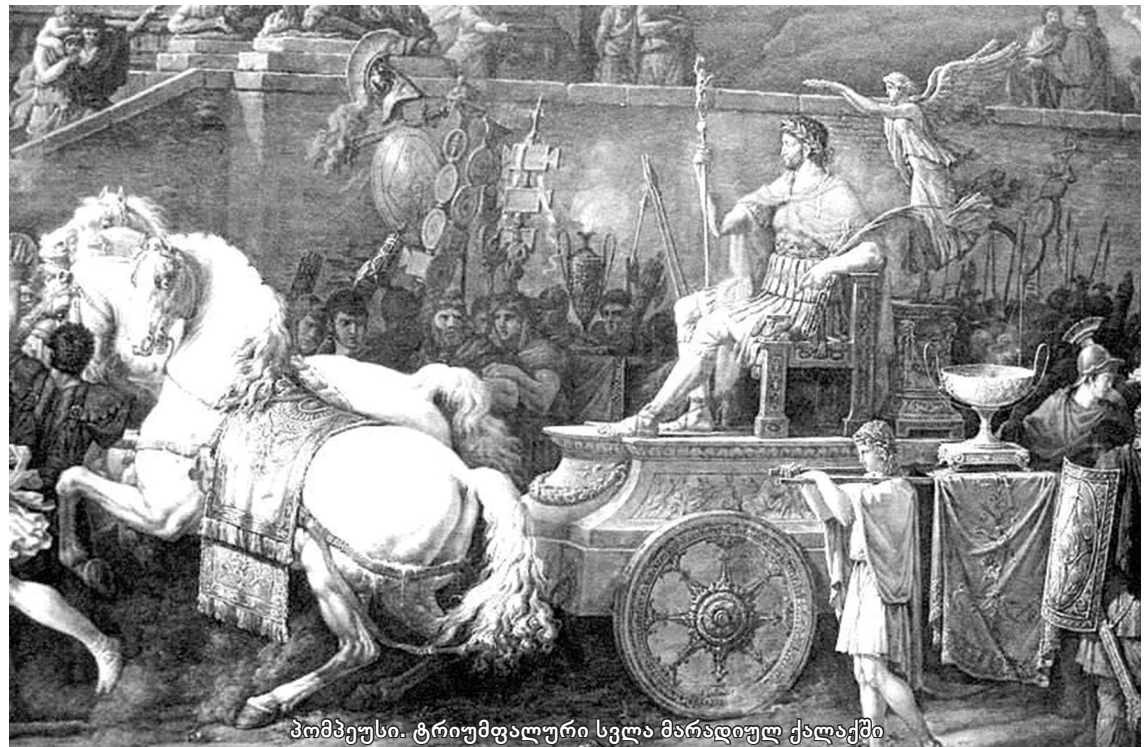
პომპეუსი. ტრიუმფალური სვლა მარადიულ ქალაქში

49 წლის ნოემბერში ცეზარი რომში დაბრუნდა, მან გაიმყარა პოზიციები ევროპაში და ზურგი გაითავისუფლა პომპეუსთან საბრძოლველად, რომელსაც აფრიკაში მხარდაჭერა ჰქონდა, იქ სიმონიდის მეფემ და პომპეუსის მომხრეებმა კეისარს მიერ გაგზავნილი კურიონის ორი ლეგიონი განაზღვრეს, რაც აფ-