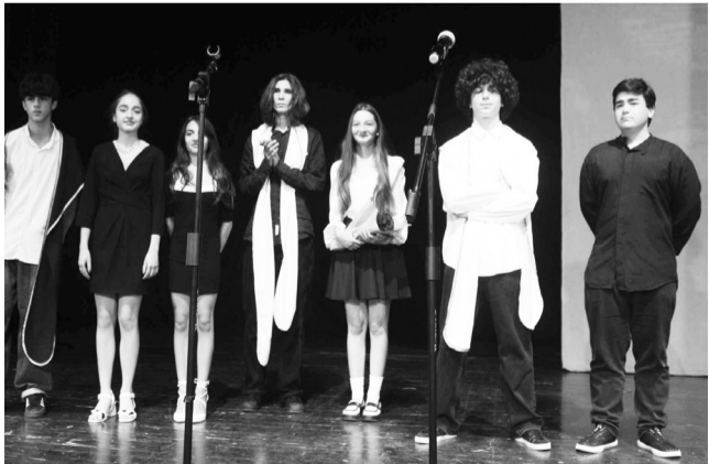
ბავშვთა და მოზარდთა თეატრალური წრე „აკვარიუმი“

კრებული, რომელიც საქართველოს მწერალთა კავშირის, აფხაზეთის კულტურისა და განათლების სამინისტროსა და გამომცემლობა „საარის“ მხარდაჭერით გამოიცა, საჩუქრად გადაეცა ავტორებს.