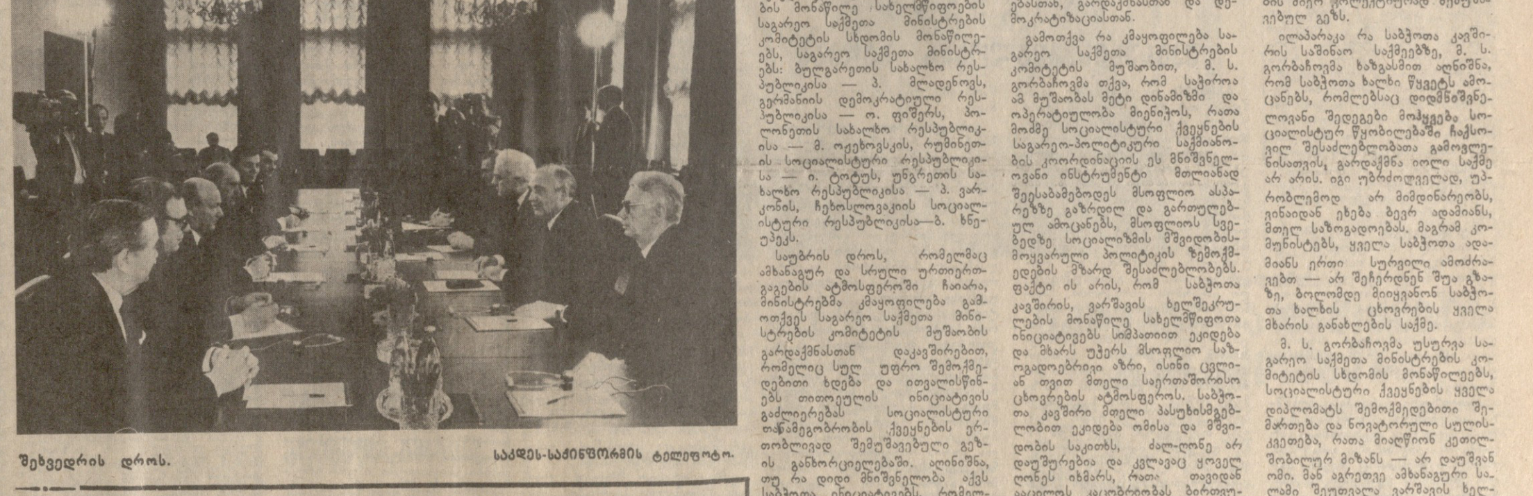
უხვედრის დროს. სკპ-ს ცენტრალური კომიტეტის სესიის დროს.