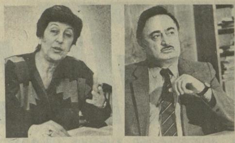
ა. ბახვალი: არის განსაკუთრებული სახეობის დეფიციტი, ვერც წოდებული „დეფიციტი“ სიტყვის დროს, როცა სახელად ვხვდებით, ასარჩევად არ არსებობს...