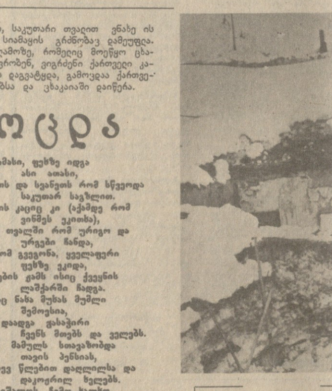
თანამდგომი პოეტი ქვეყანა

დასაბამიდან კი ვიყავით მდიდარი მტრებით, მაგრამ მძვინვარე და შეგვიძლია...“