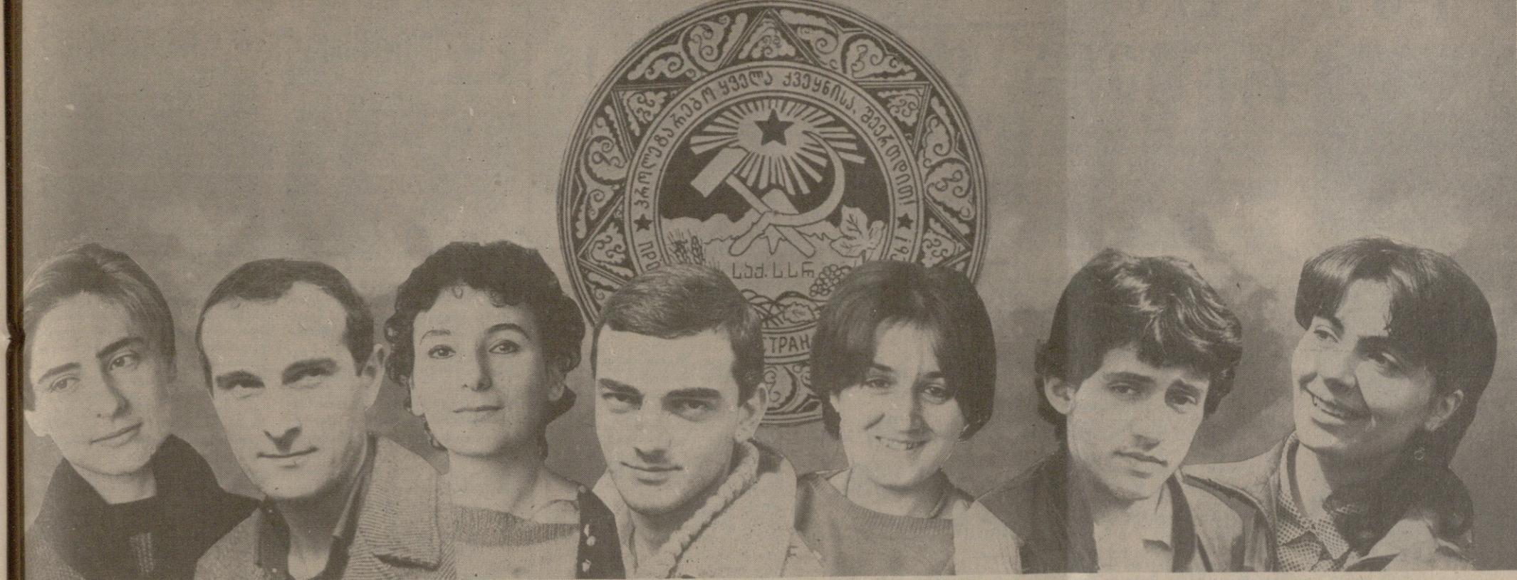
კე, მკშულო, გრანტა ზენი მოვლისა მარად ყველა ჩვენთაჲნის ვალია... (გალაბტიონი). დ. იაკობაშვილის ფოტოგრაფი.